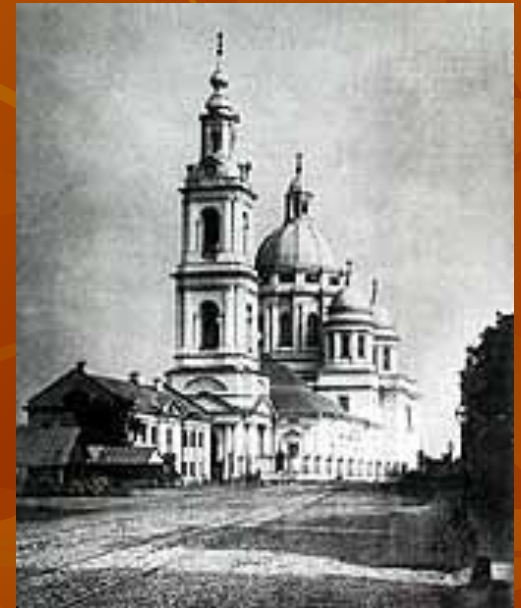
Елоховский собор, где крестили Пушкина

❖ О Москве, о том, что он родился в Москве, Пушкин всегда говорил с гордостью.