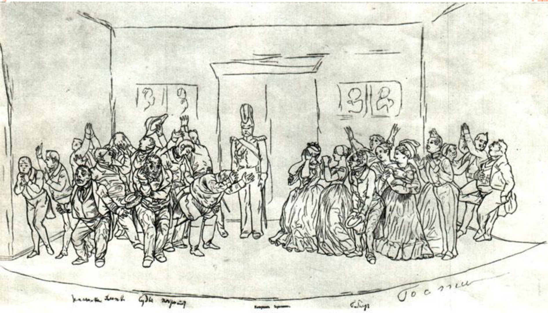
«РЕВИЗОР». ЗАКЛЮЧИТЕЛЬНАЯ СЦЕНА. Рисунок Н. В. Гоголя (?)