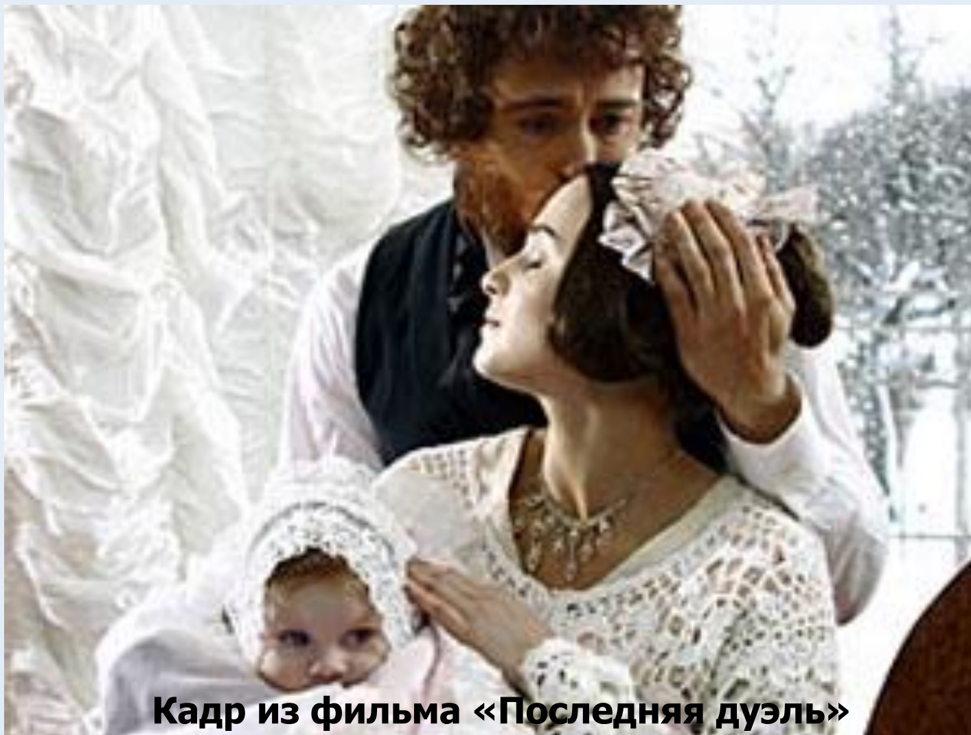
Кадр из фильма «Последняя дуэль»