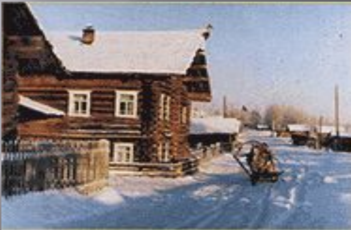
Веркольская улица зимой.