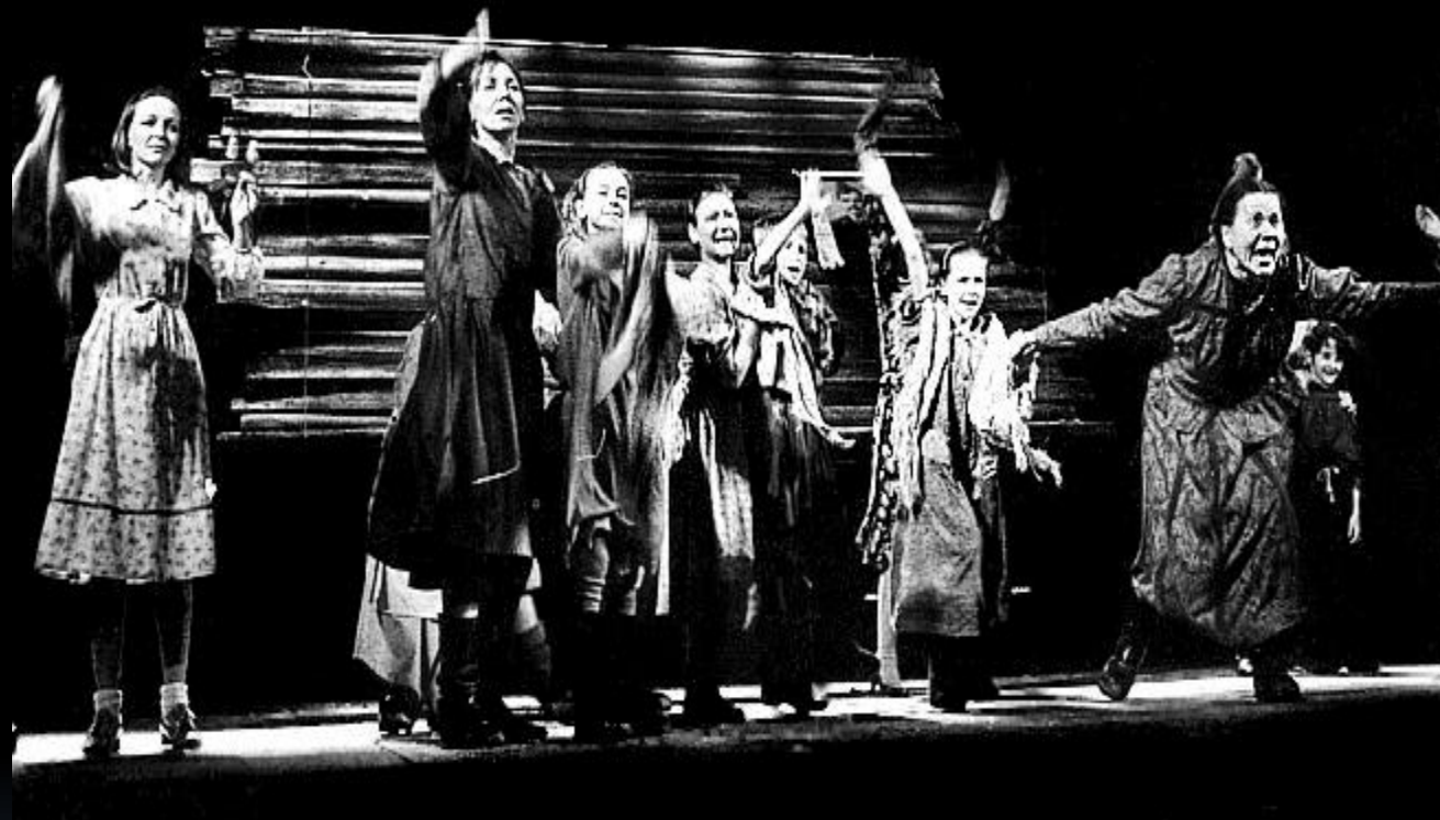
БРАТЯ И СЕСТРЫ (сцена из спектакля)