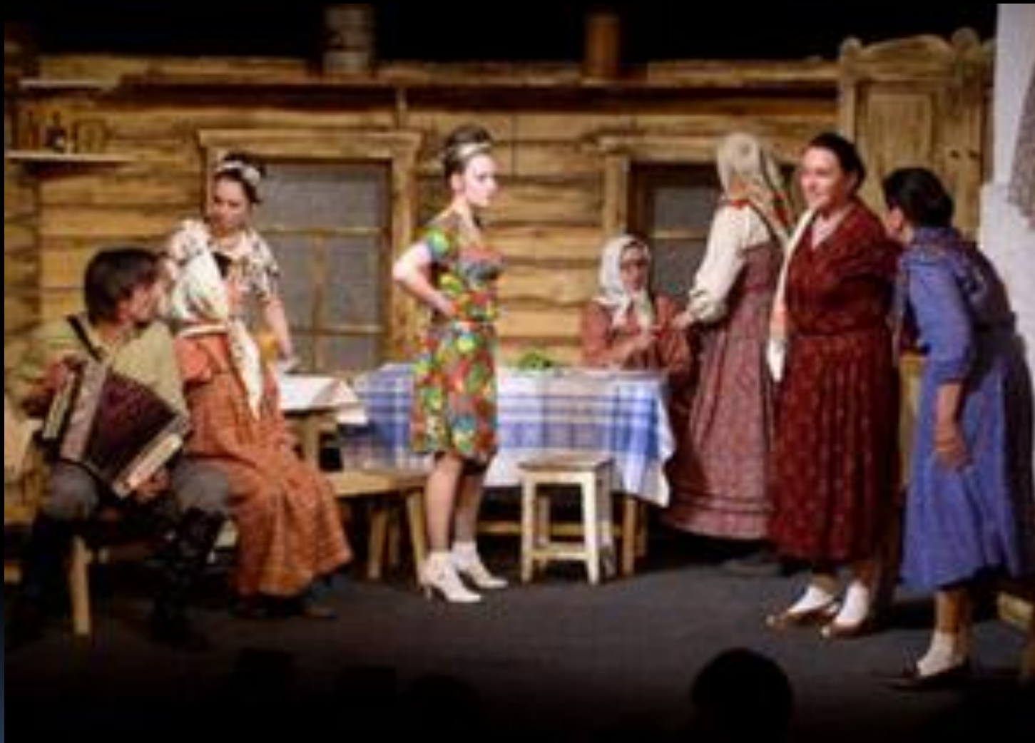
Спектакль « Б А Б И Л Е Й » по рассказам Ф. Абрамова