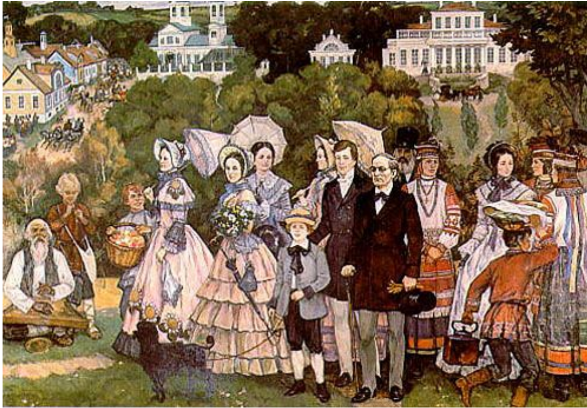
Ф.И. Тютчев с семьей на народном празднике в Овстуге. С картины Б. Бельтюкова