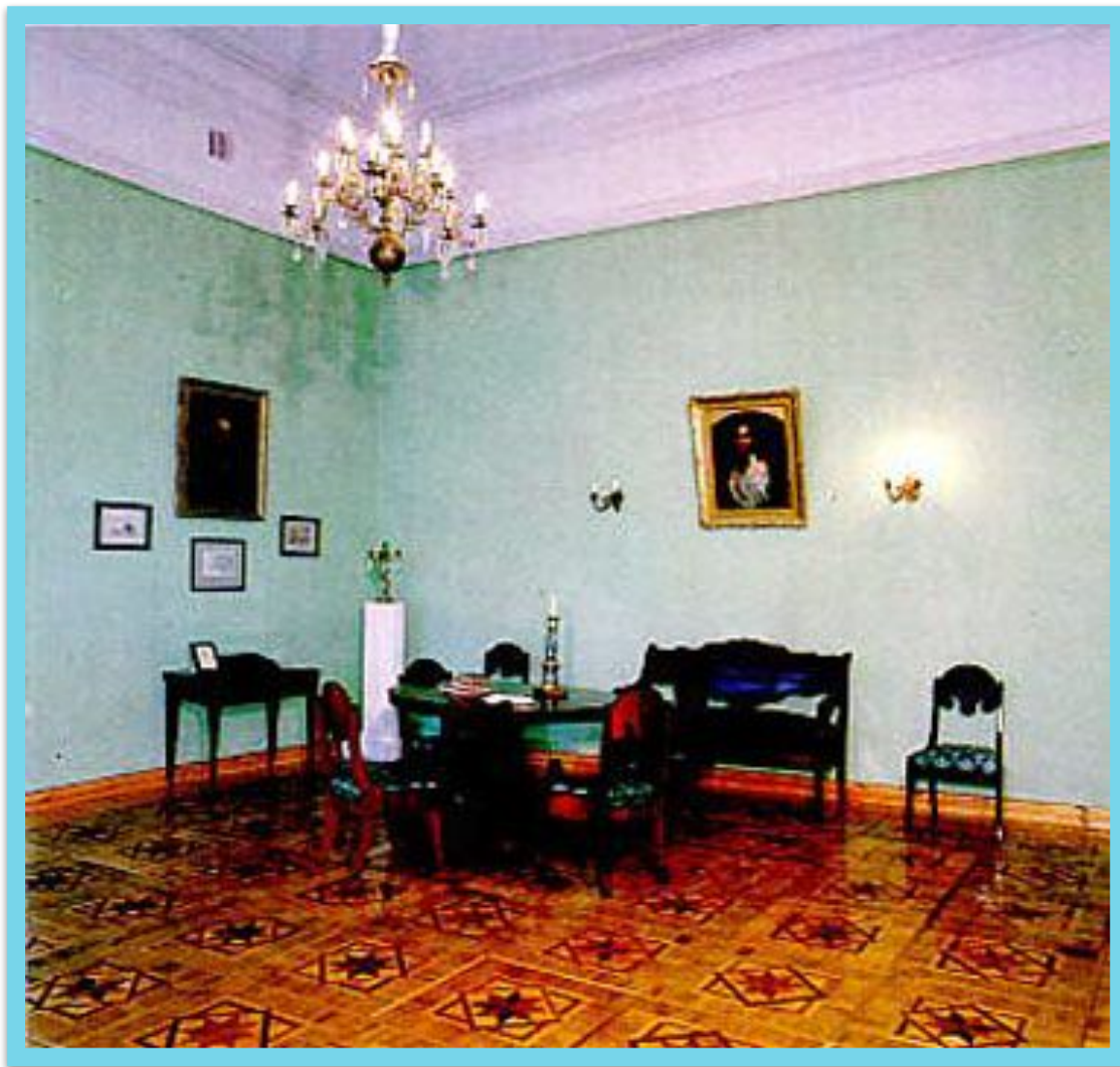
Гостиная в доме Ф.И. Тютчева