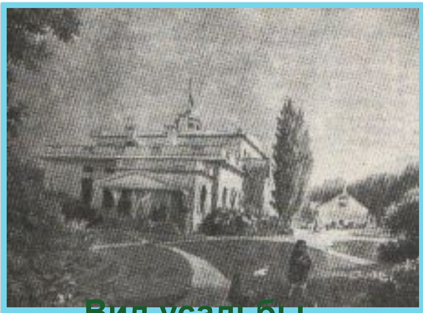
Вид усадьбы Овстюг