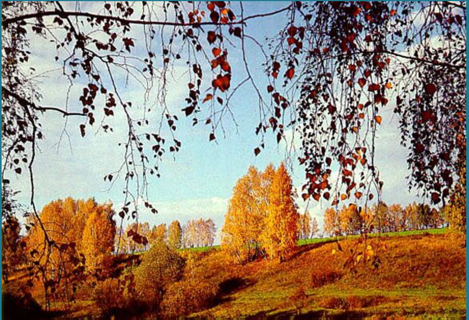
Окрестности села Овстуг