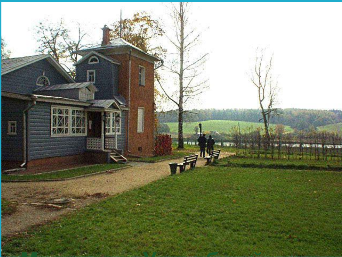
Мураново. Усадебный дом.