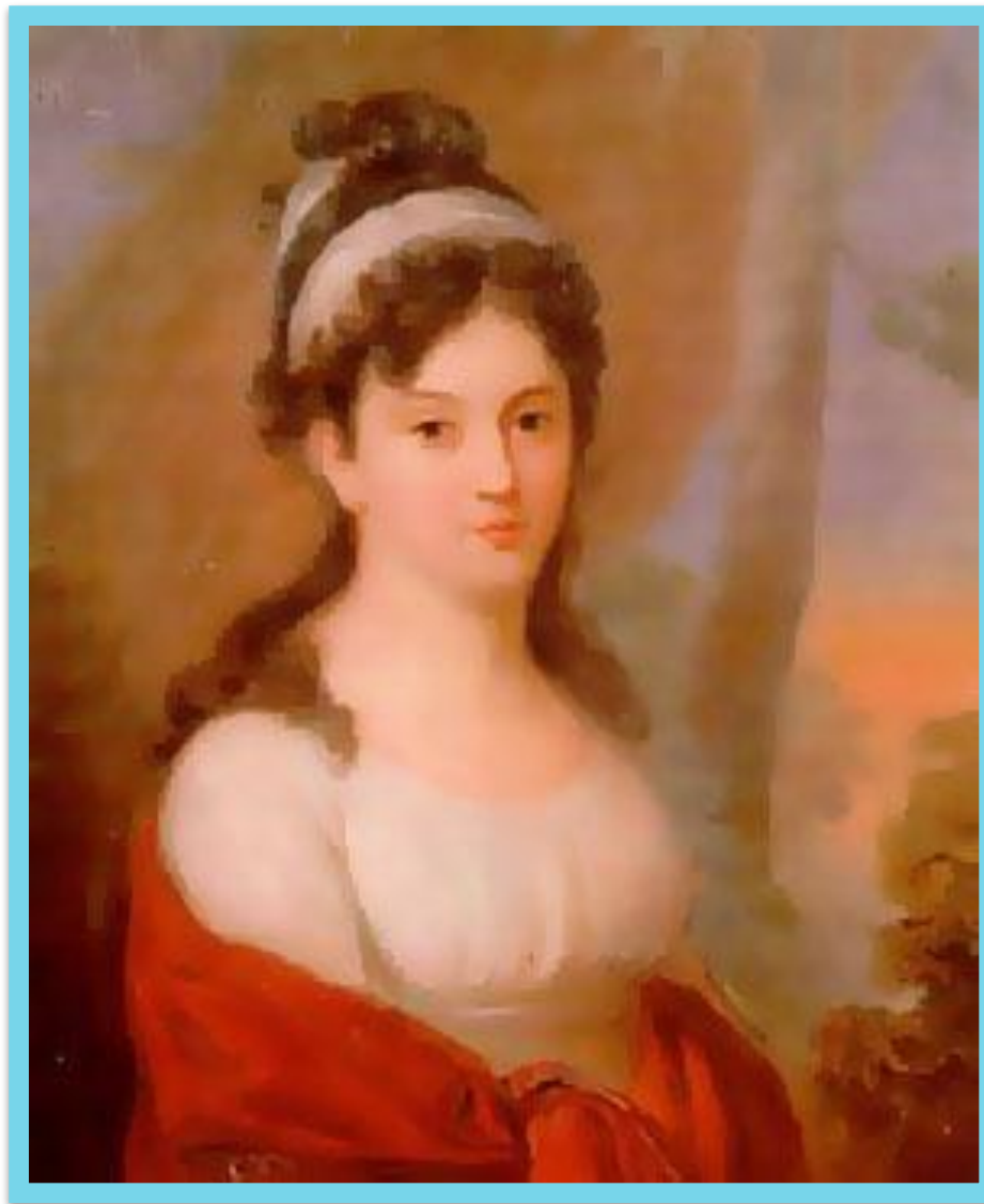
Екатерина Львовна Тютчева. Мать поэта.