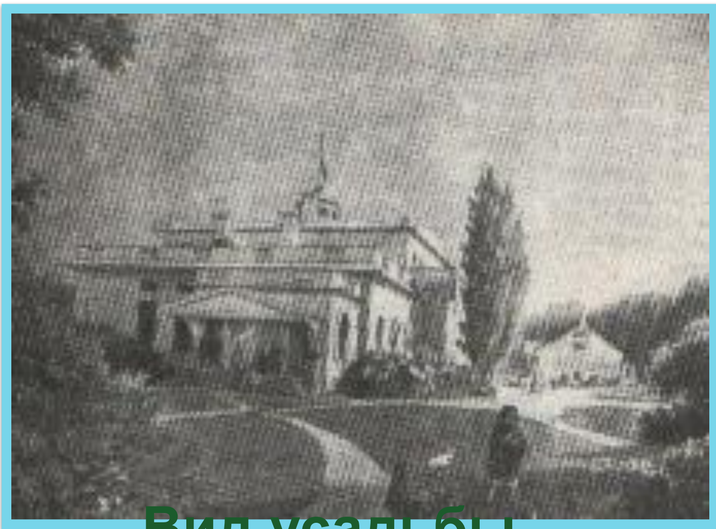
Вид усадьбы Овстюг