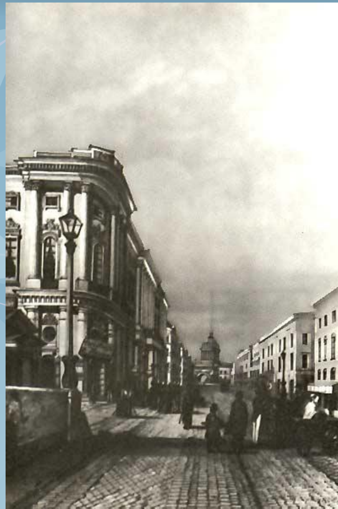
Петербург в XIX веке

az.lib.ru/img/f/fet_a_a/text_0018/index.shtml