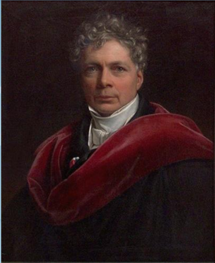
Фридрих Вильгельм Йозеф фон Шеллинг (1775-1854)