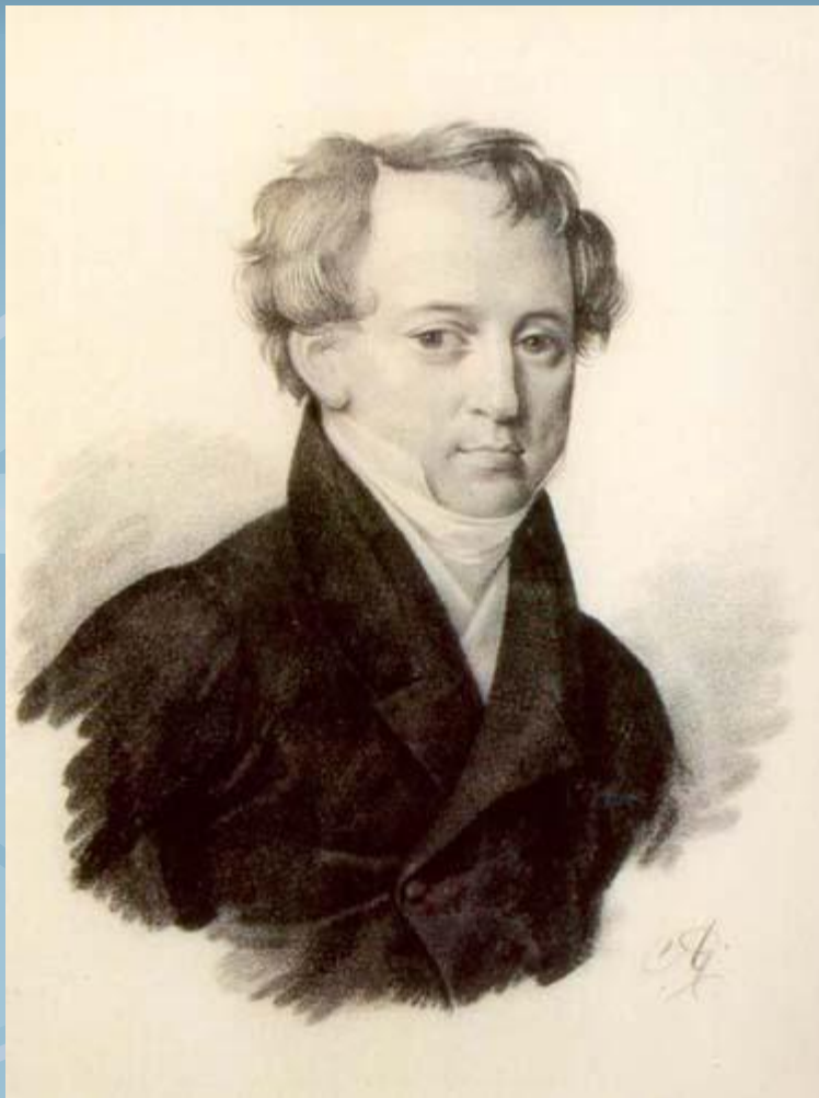
Молодой Тютчев в период службы в Петербурге