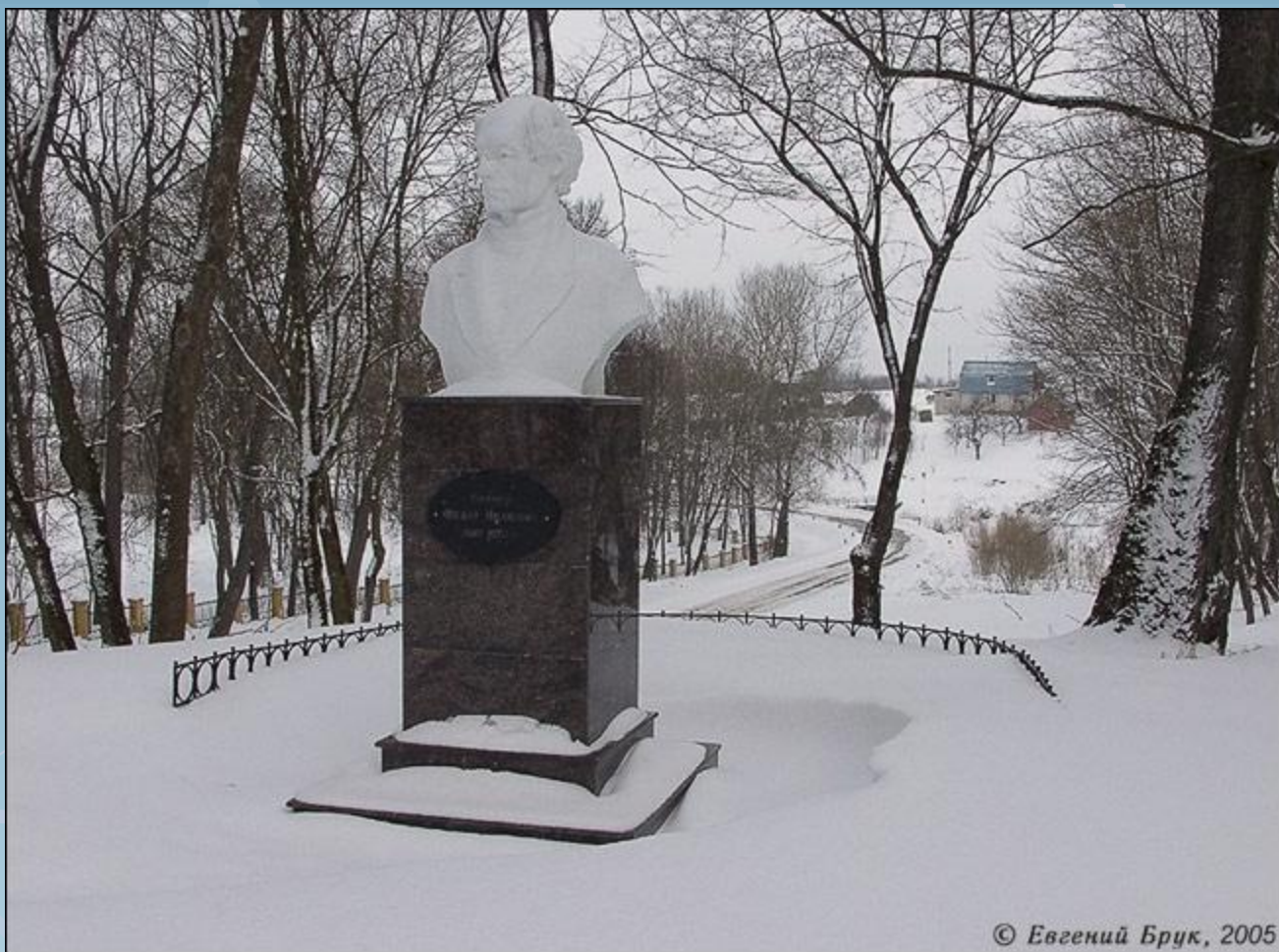
Бюст Тютчева в с. Овстуг