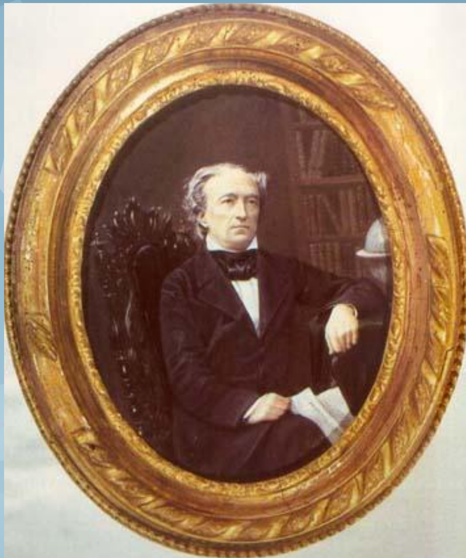
Ф.И. Тютчев в годы дипломатической службы в Турине