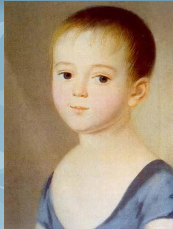
Тютчев в детстве