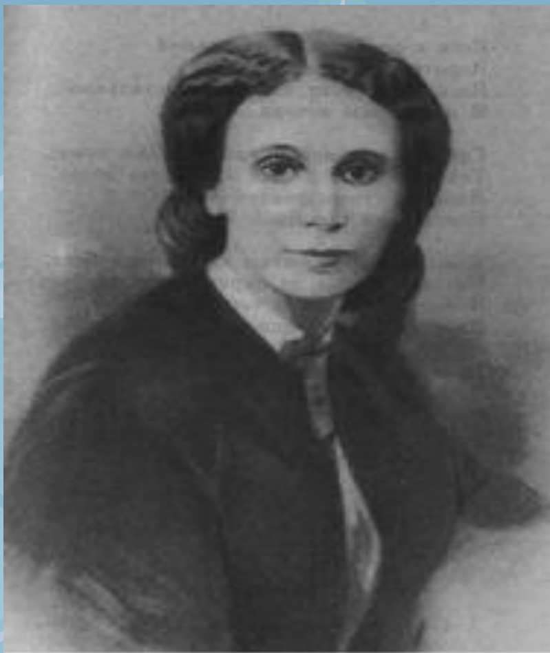
Елена Александровна Денисьева (1826 – 1864)

Сборник стихотворений, вышедший в 1854 году, был посвящен Елене Денисьевой. "Беззаконные" в глазах света отношения немолодого поэта с ровесницей его дочери продолжались в течение 14 лет и были очень драматичны, ведь Тютчев был женат. Эти отношения начались в июле 1850 года и закончились 4 августа 1864 года безвременной смертью Е.А. Денисьевой в Петербурге. Роковая и трагическая "последняя любовь" Тютчева родила прекрасные лирические стихотворения "денисьевского цикла". Его стихотворение "О, как убийственно мы любим" (1851) стало историей такой мучительной, греховной, осуждаемой обществом любви.