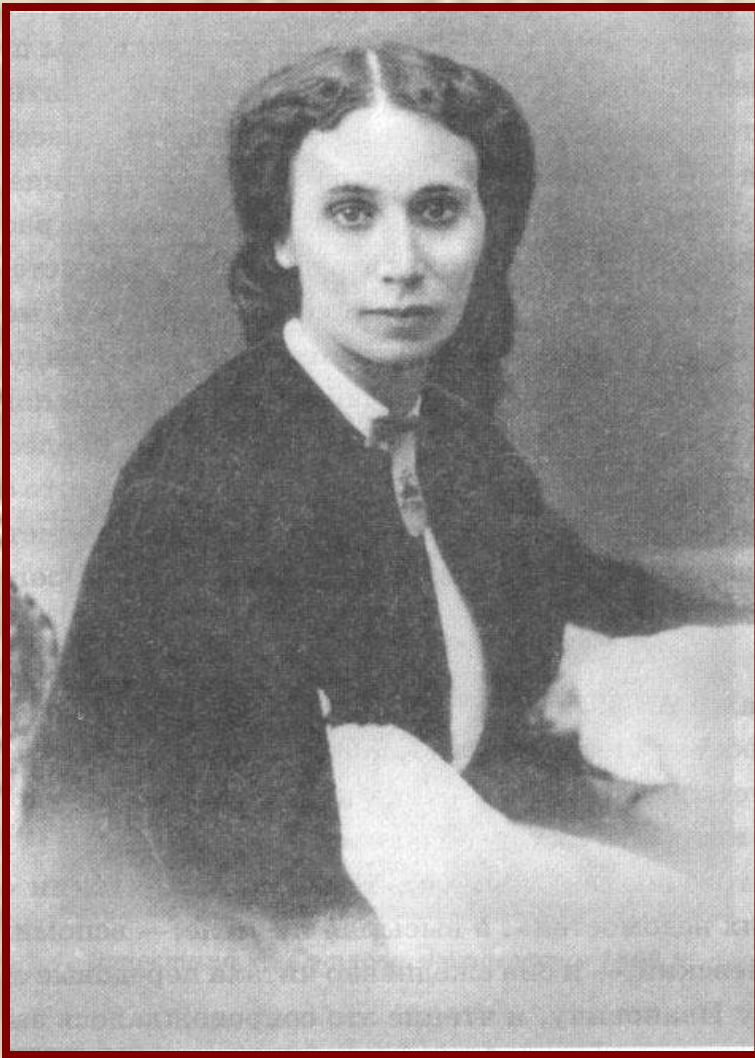
Е. А. Денисьева. Фотография 1862 г.