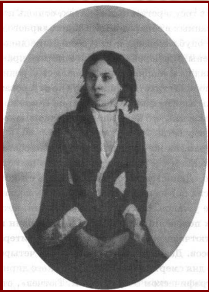
Е. А. Денисьева. Дагерротип. Начало 1850-х гг.