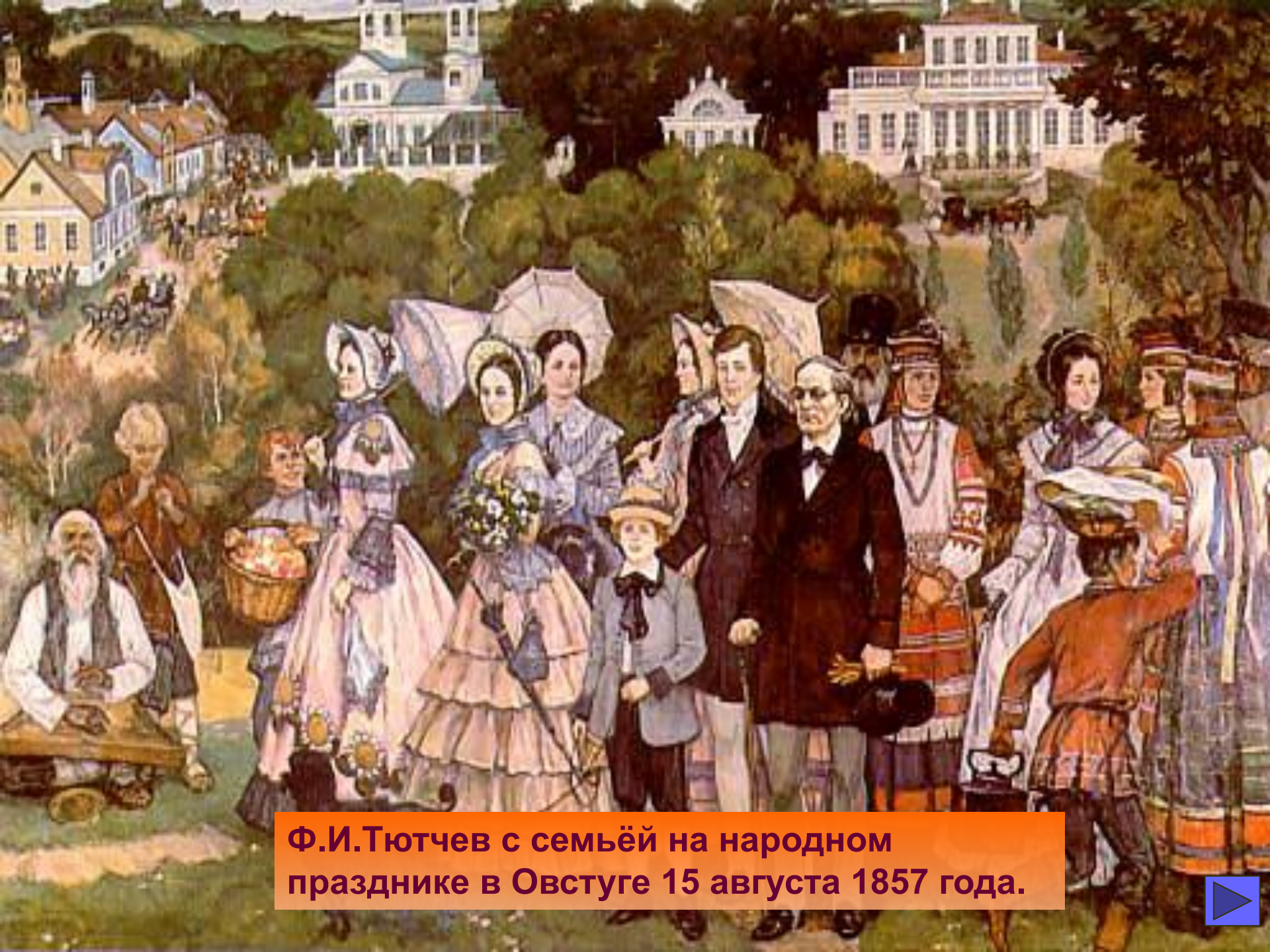
Ф.И.Тютчев с семьёй на народном празднике в Овстуге 15 августа 1857 года.