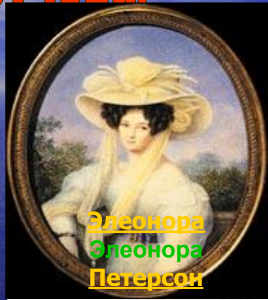
Элеонора Элеонора Петерсон