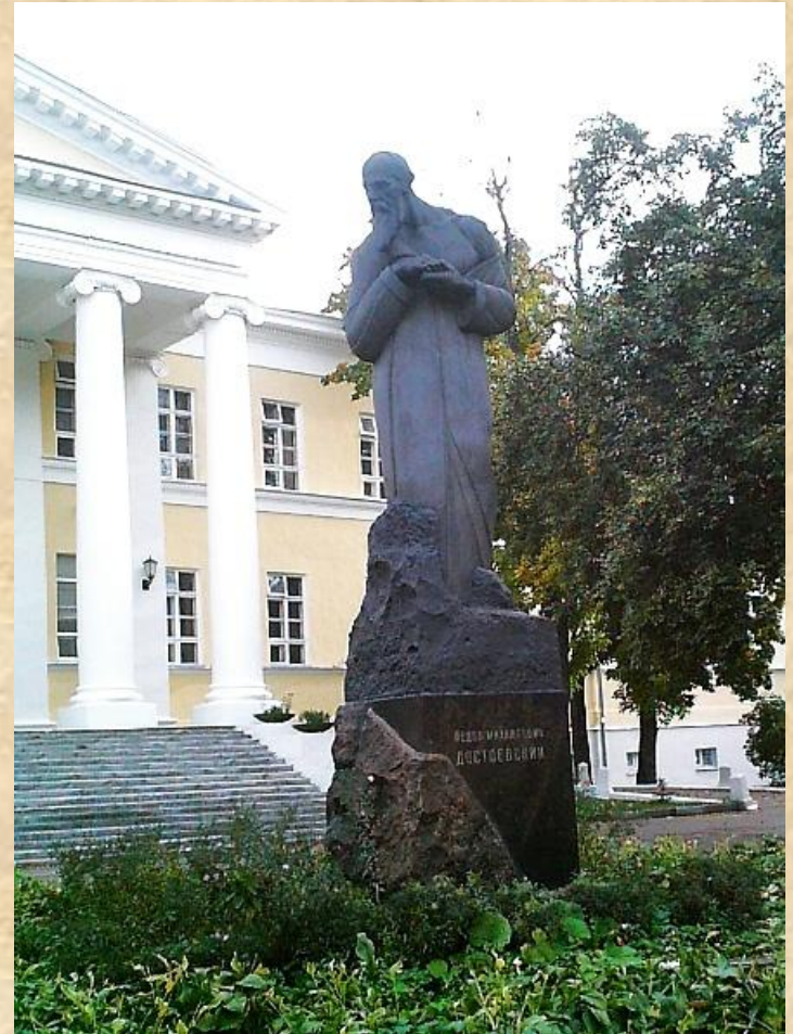
Памятник Достоевскому в Москве, рядом с местом рождения