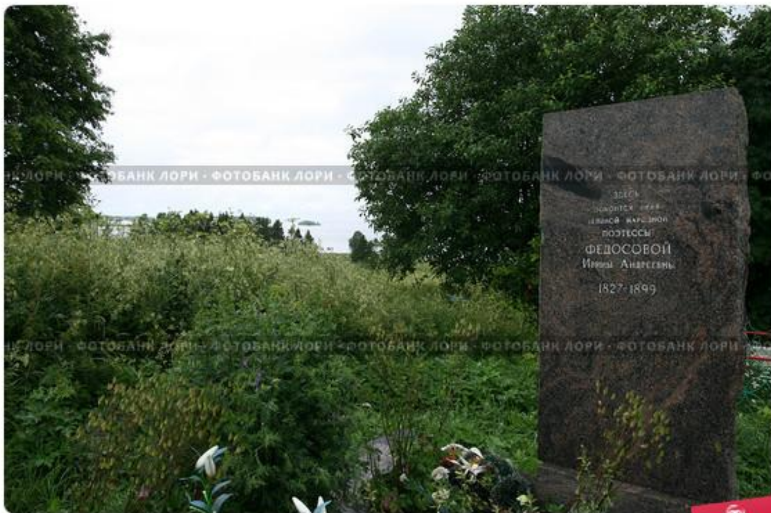
Карелия. Заонежье. Памятник на могиле И.А. Федосовой, народной поэтессы-сказачки