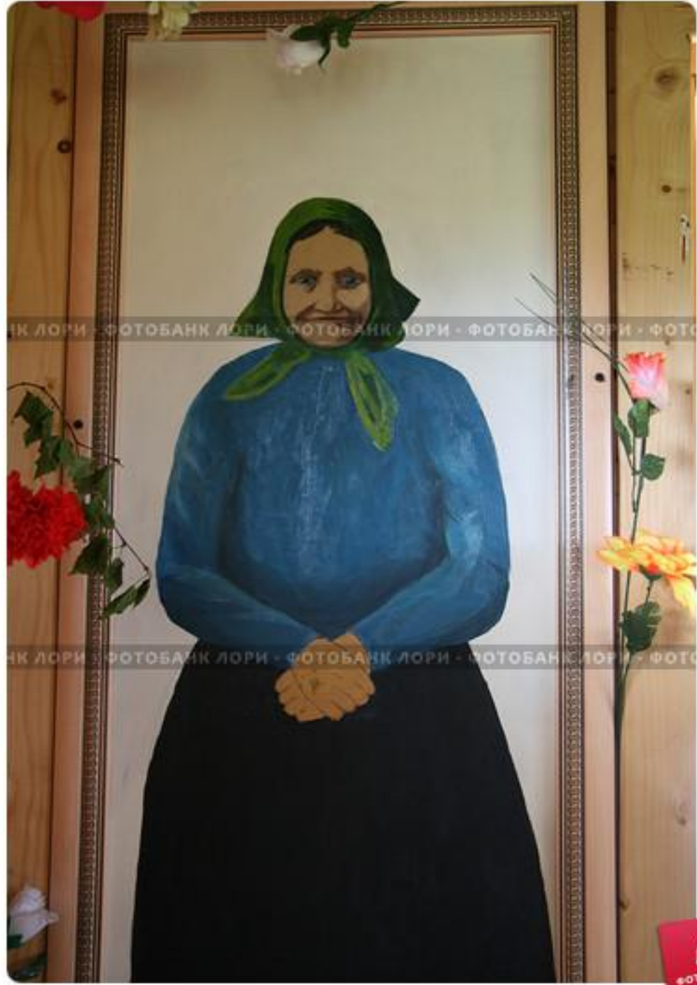
Карелия. Заонежье. Часовня Святого Георгия Победоносца. Портрет И.А.