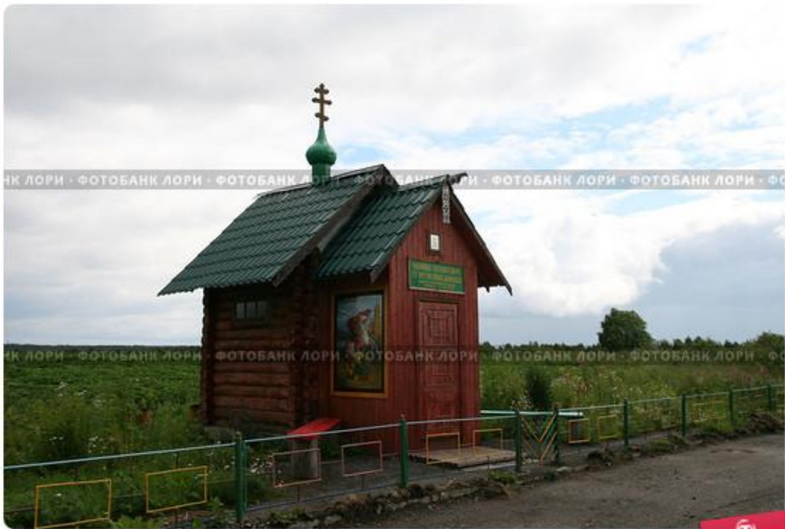
Карелия. Заонежье. Часовня Святого ВМЧ Георгия Победоносца (установлена в 2011 году)