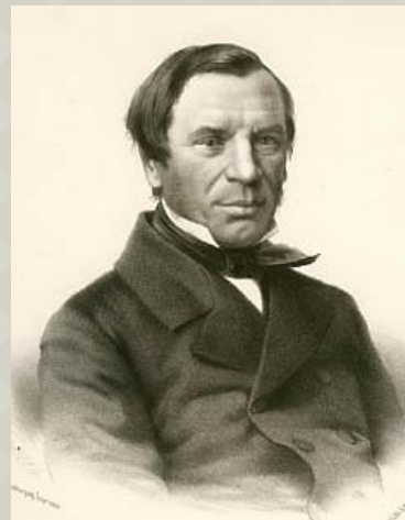
М. П. Погодин

вскоре за тем Афанасий Афанасьевич поступил в Московский университет на историко-филологический факультет.