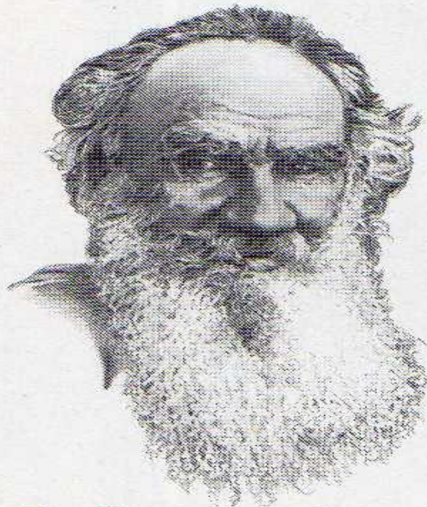
Лев Николаевич Толстой 1828—1910