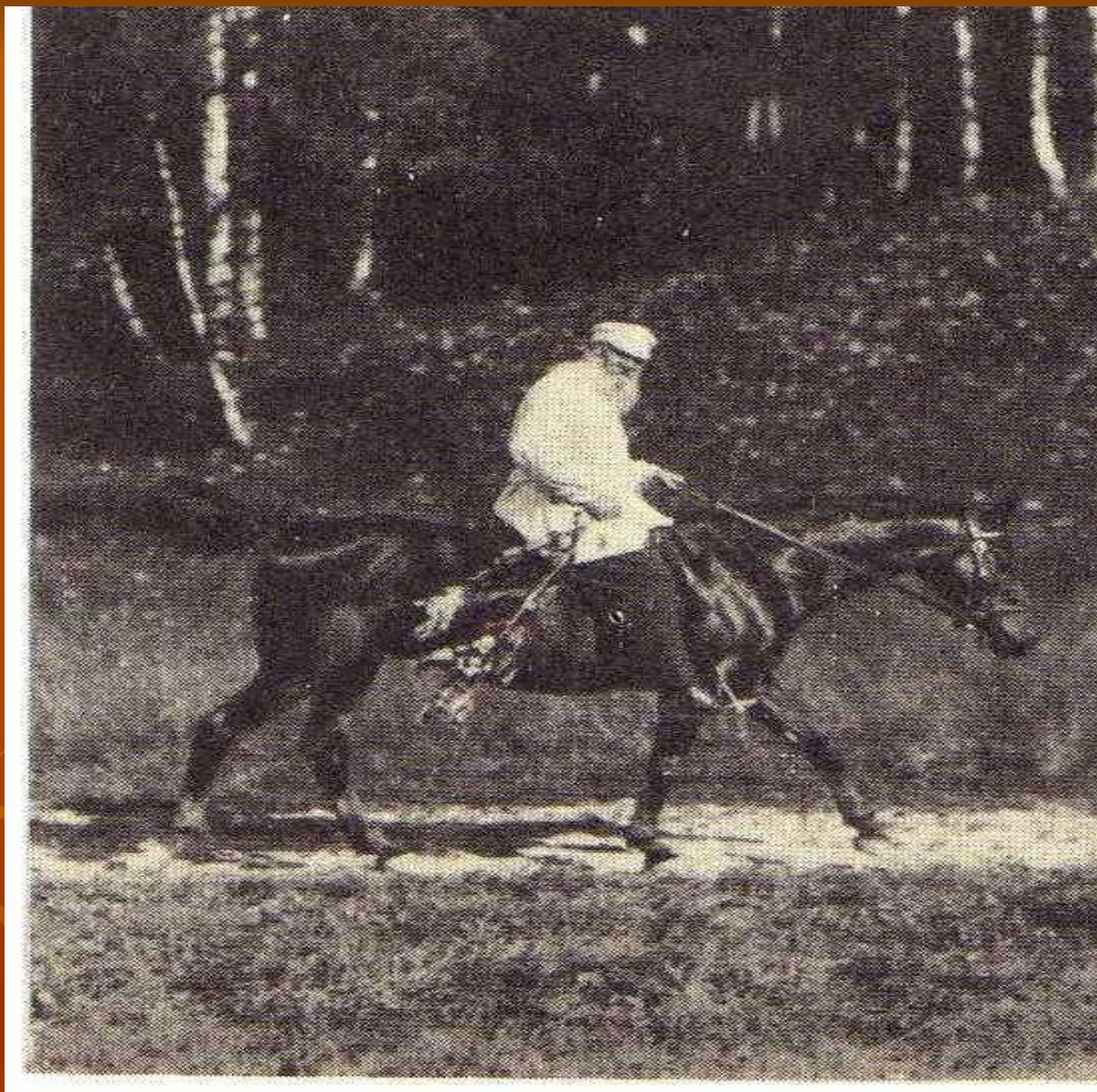
Л.Н.Толстой верхом в окрестности Ясной Поляны. 1908 г.