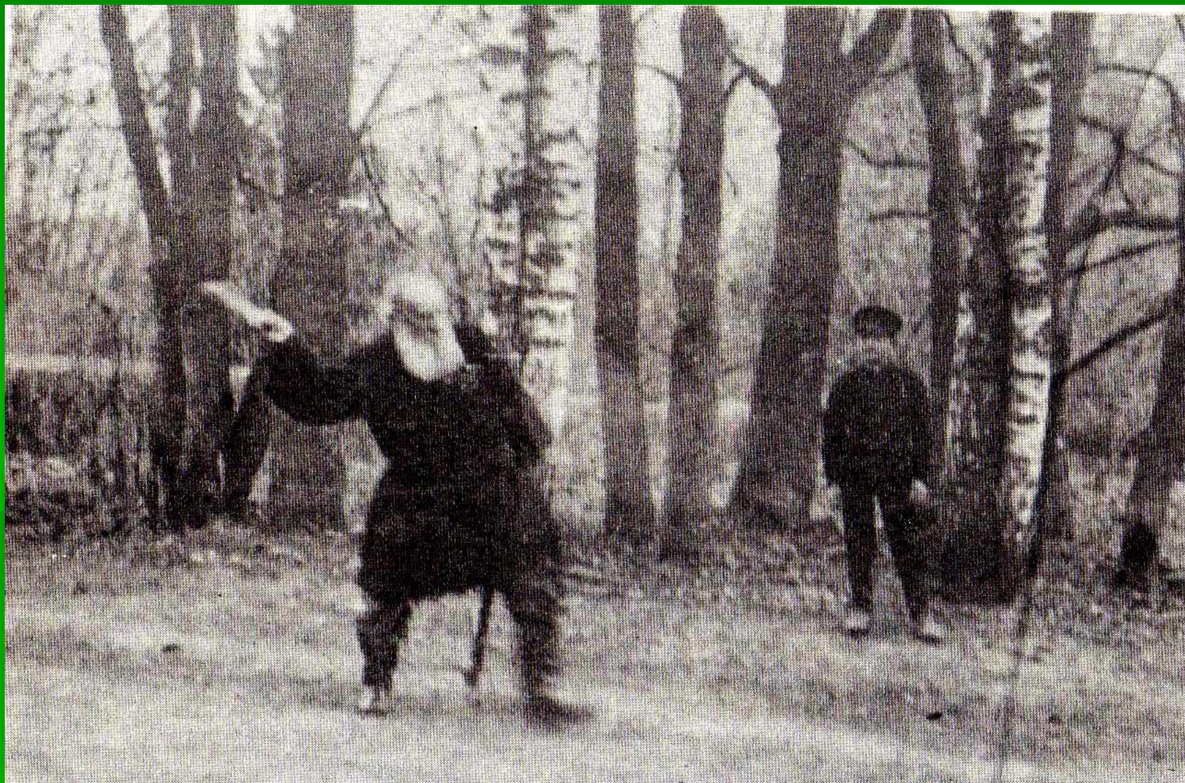
Л.Н.Толстой за игрой в городки. 1908 г.