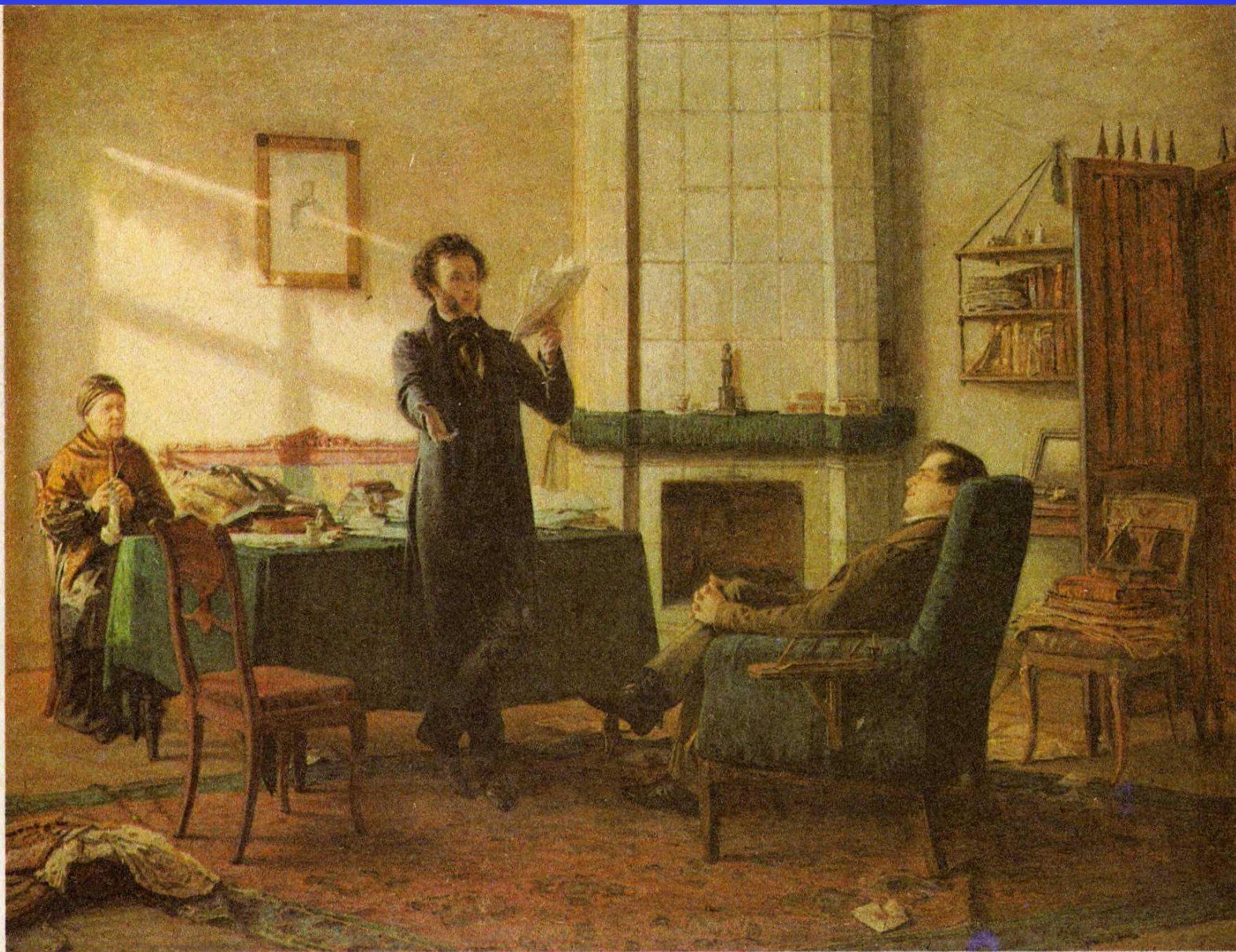
Н. Н. Ге. А. С. Пушкин в селе Михайловском.