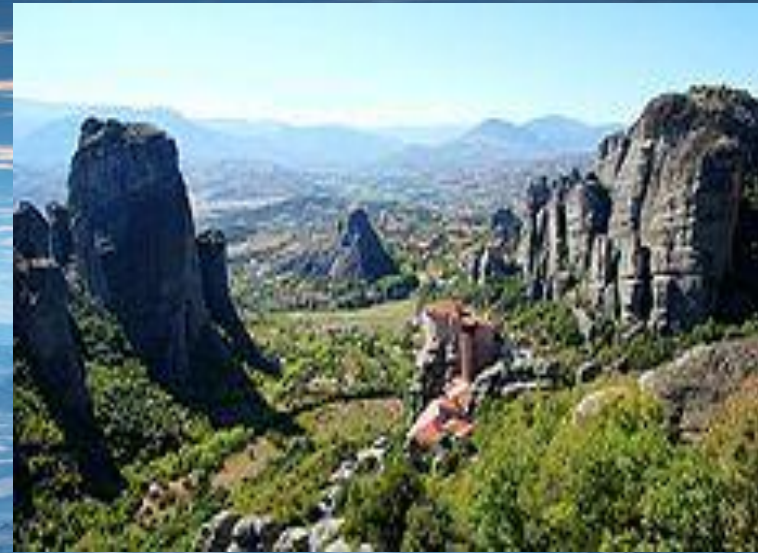
Метеоры. Центральная Греция