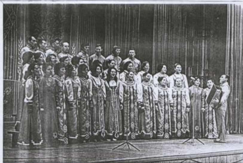
Хор жителей с. Малые Ялурны. 1973 г.