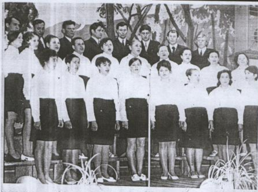
Хор жителей с. Малые Ялурны. 1965 г.