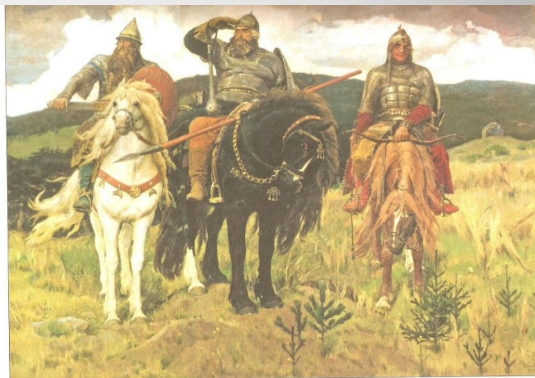
Картина в галерее

93. Рассмотрите в «Картинной галерее» учебника репродукцию картины Виктора Михайловича Васнецова «Богатыри».