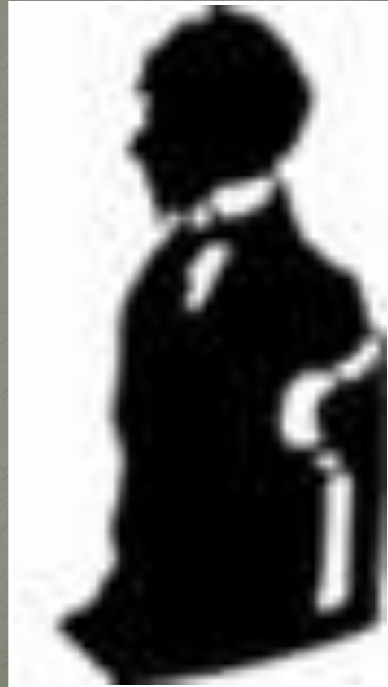
Силуэт работы Е. Кругликовой