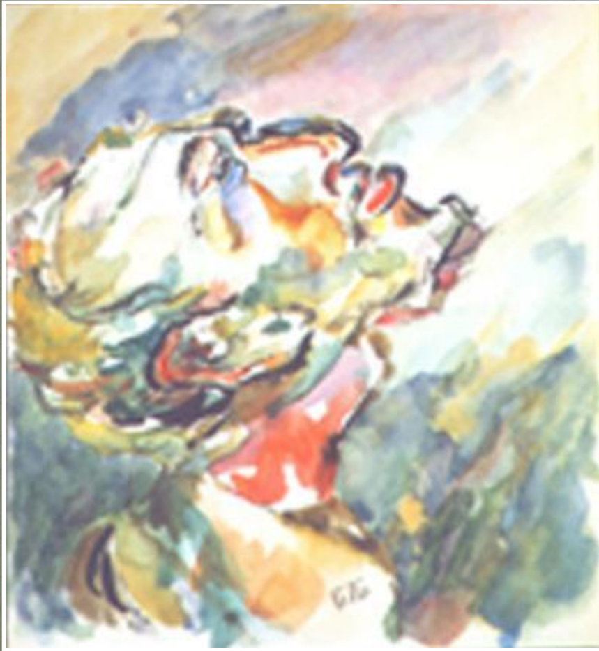
Портрет работы Б. Будницкого