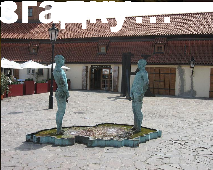
Музей Франца Кафки в Празі