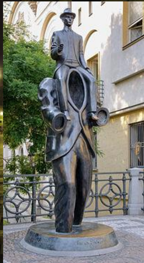
Пам'ятник Францу Кафці (Прага)