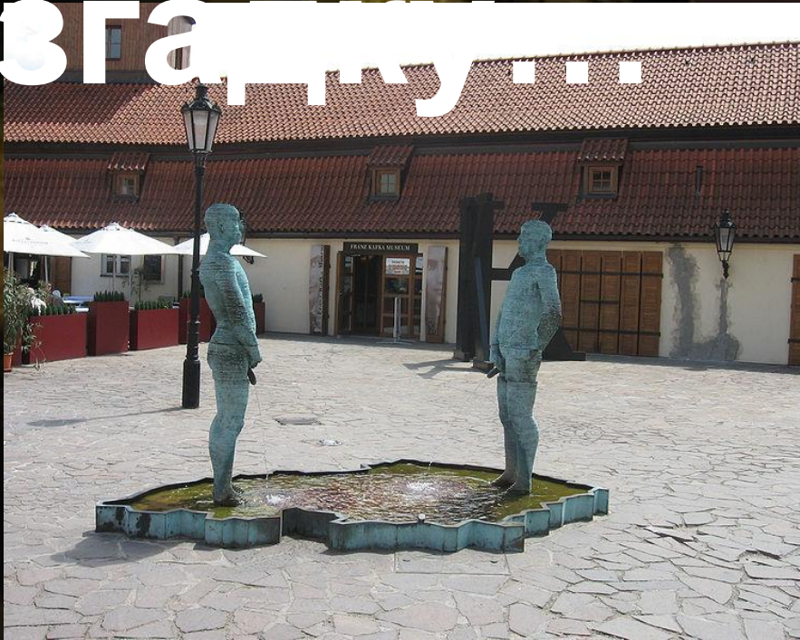
Музей Франца Кафки в Празі