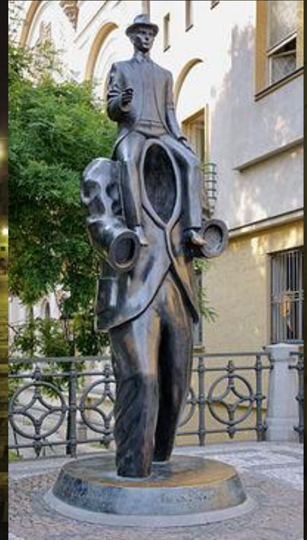
Пам'ятник Францу Кафці (Прага)