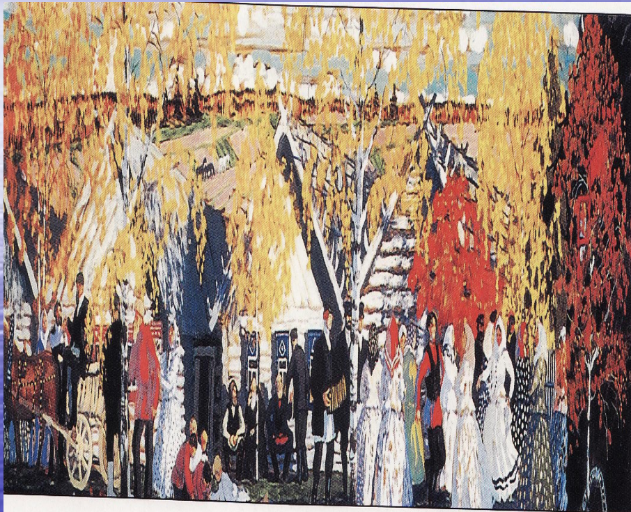
Деревенский праздник. Худ. Б.Кустодиев. 1910

Свадьбы справлялись в зазимье, В свадебник месяц, Глухарями украсив дугу.