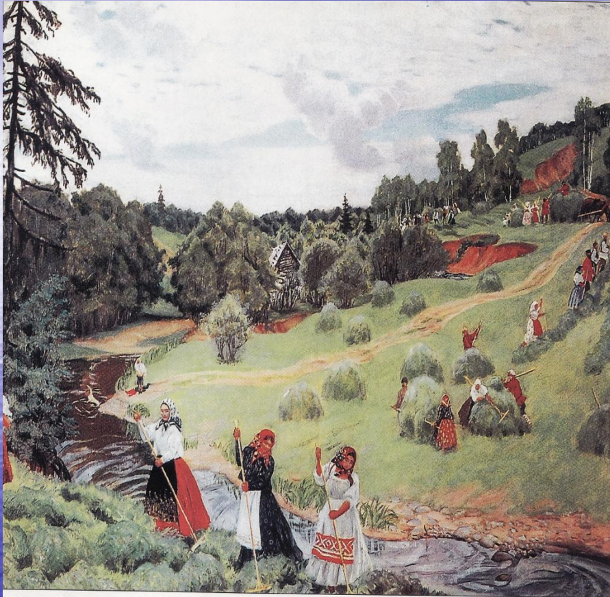
Сенокос. Худ. Б.Кустодиев. 1917