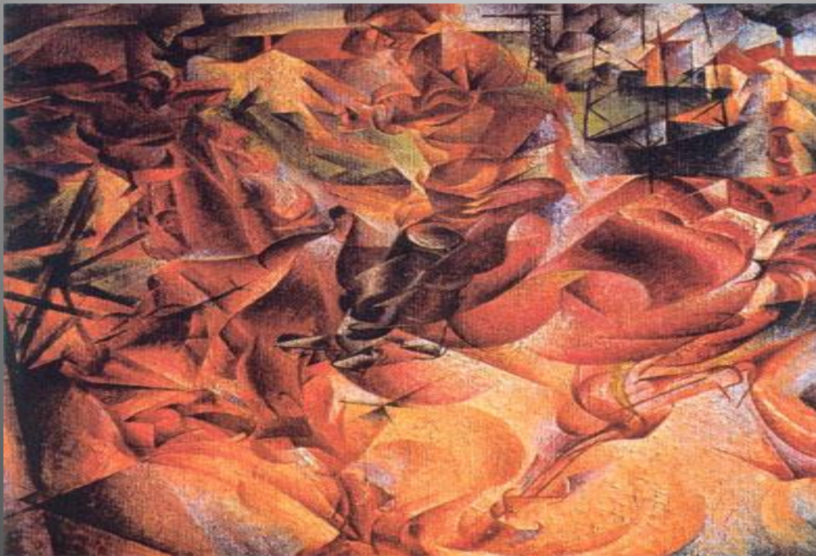
Умберто Боччони «Эластичность» 1912г.

Футуризм исходил из восхищения к технической цивилизации. Художники изображали сюжеты из производственного процесса, движение, скорость, технические формы машин. Спокойная и статистическая форма делилась на фазы. Стремление «симультанно» подхватить несколько действий, происходящих одновременно ( Балла, Кара, Северини, Боччони)