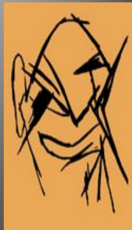
М.Ларионов Портрет А.Кручёных