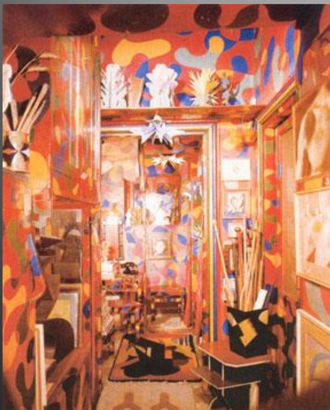
Интерьер дома Джакомо Балла в Риме. Конец 20х - начало 30х

Футуризм – авангардистское литературное течение начала 20 века, отрицавшее художественное и нравственное наследие, проповедовавшее слияние искусства с ускоренным жизненным процессом. В переводе с латинского- будущее.