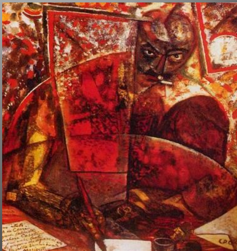
Портрет Маринетти (1910-1911г.) Ружена Заткова