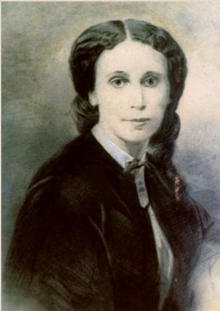
Елена Александровна Денисьева 1826 - 1864