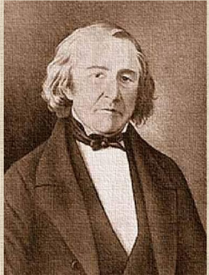
С.Е.Раич учитель Ф.И.Тютчева

Осенью 1819 года Тютчев стал студентом словесного факультета Московского университета, который окончил в 1821 году со степенью кандидата. В эти годы он сблизился с будущими любомудрами: писателем Владимиром Одоевским, литературным критиком Иваном Киреевским, поэтом Дмитрием Веневитиновым.