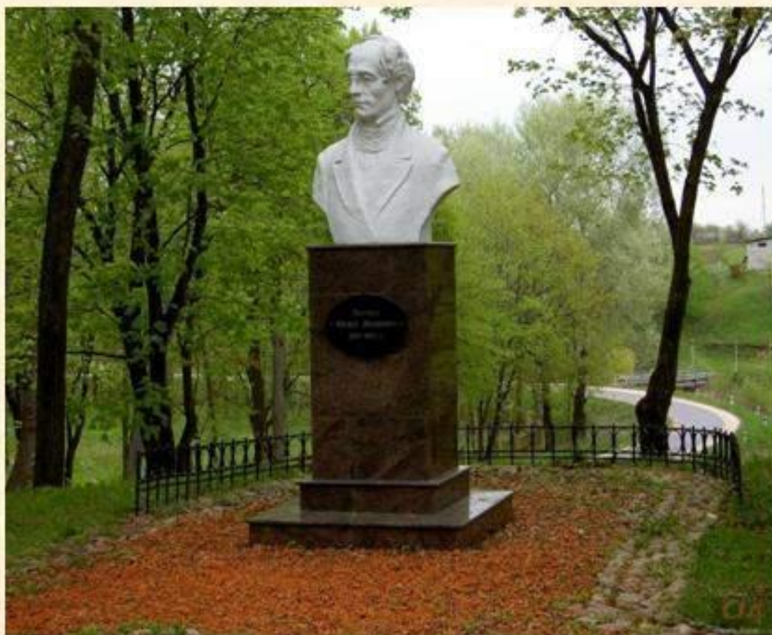
Памятник Ф.И. Тютчеву в Овстуге