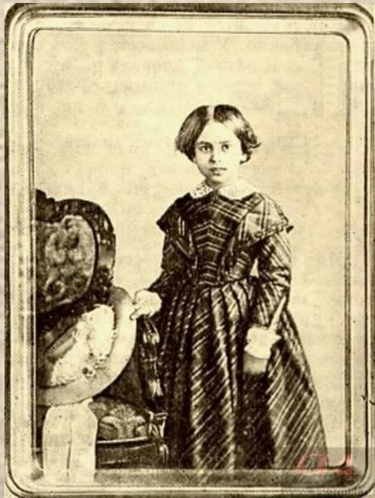
Мария Федоровна Тютчева, дочь поэта. Фото 1848–1849.