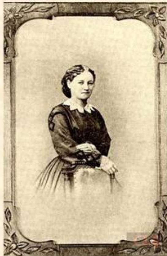
Анна Федоровна Тютчева, дочь поэта. Фото 1865