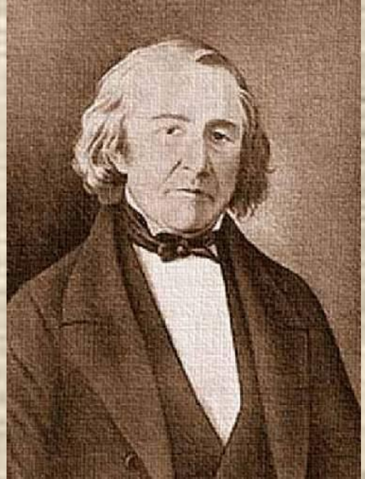
С.Е.Раич учитель Ф.И.Тютчева

Осенью 1819 года Тютчев стал студентом словесного факультета Московского университета, который окончил в 1821 году со степенью кандидата. В эти годы он сблизился с будущими любомудрами: писателем Владимиром Одоевским, литературным критиком Иваном Киреевским, поэтом Дмитрием Веневитиновым.