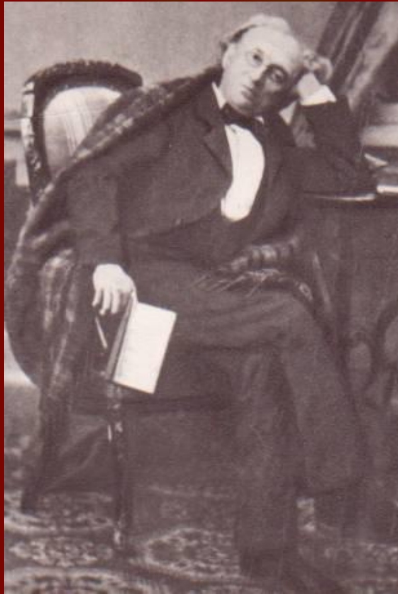
Ф.И.Тютчев. Конец 1860-х годов