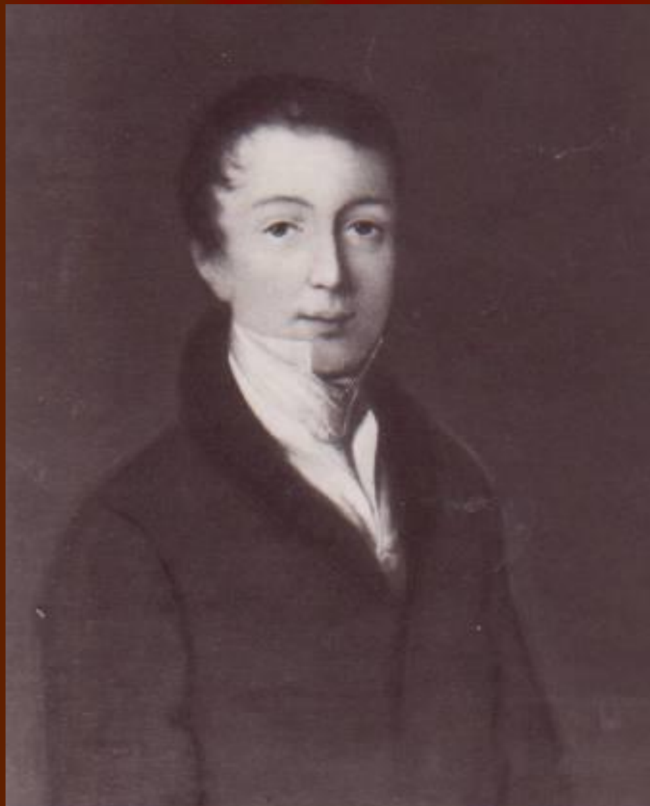
Ф.И.Тютчев в начале 1820-х годов