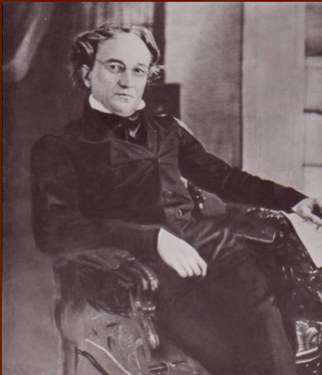
Ф.И.Тютчев в конце 1840-х годов