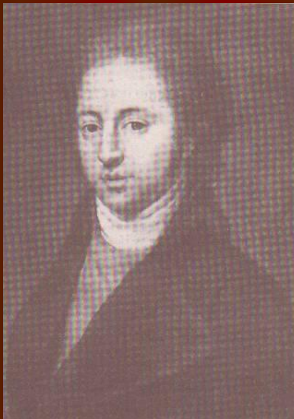
И.Н.Тютчев, отец поэта