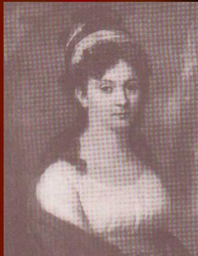
Е.Л.Тютчева, мать поэта