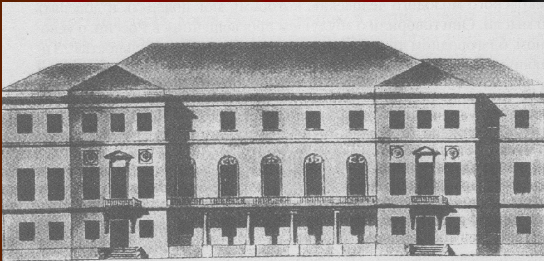
Дом Тютчевых в Москве, в котором Ф.И.Тютчев жил в 1811 – 1822 гг.