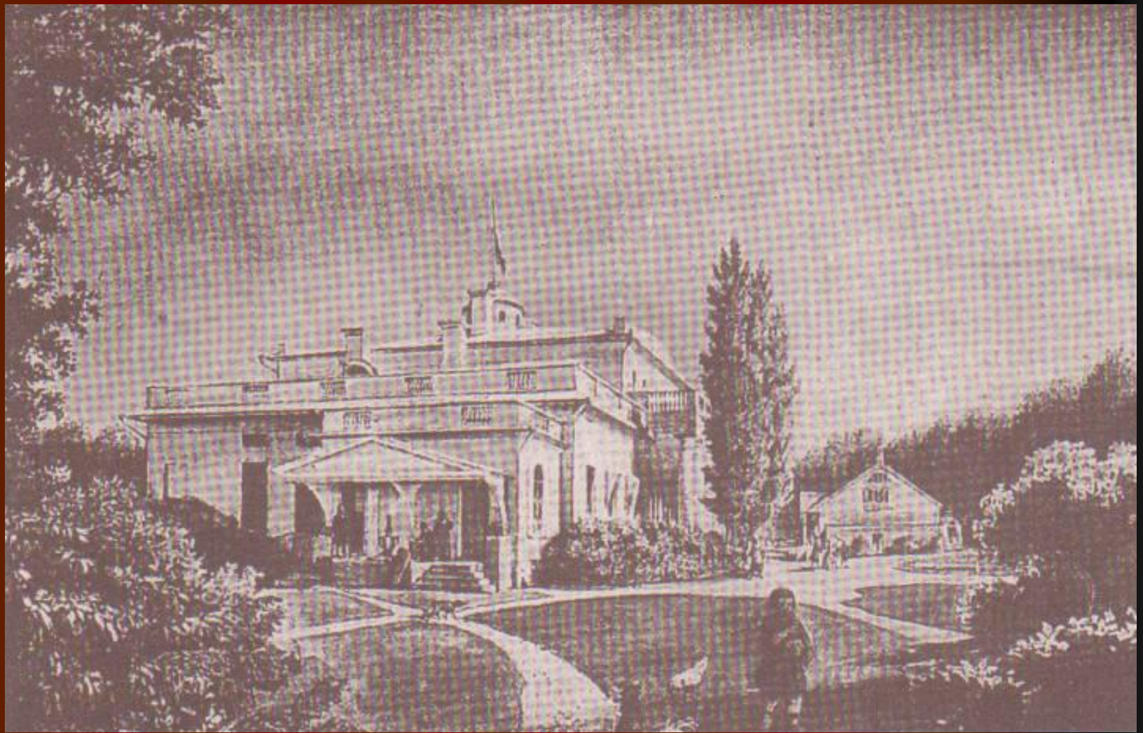
Вид усадьбы Овстуг 1861 год