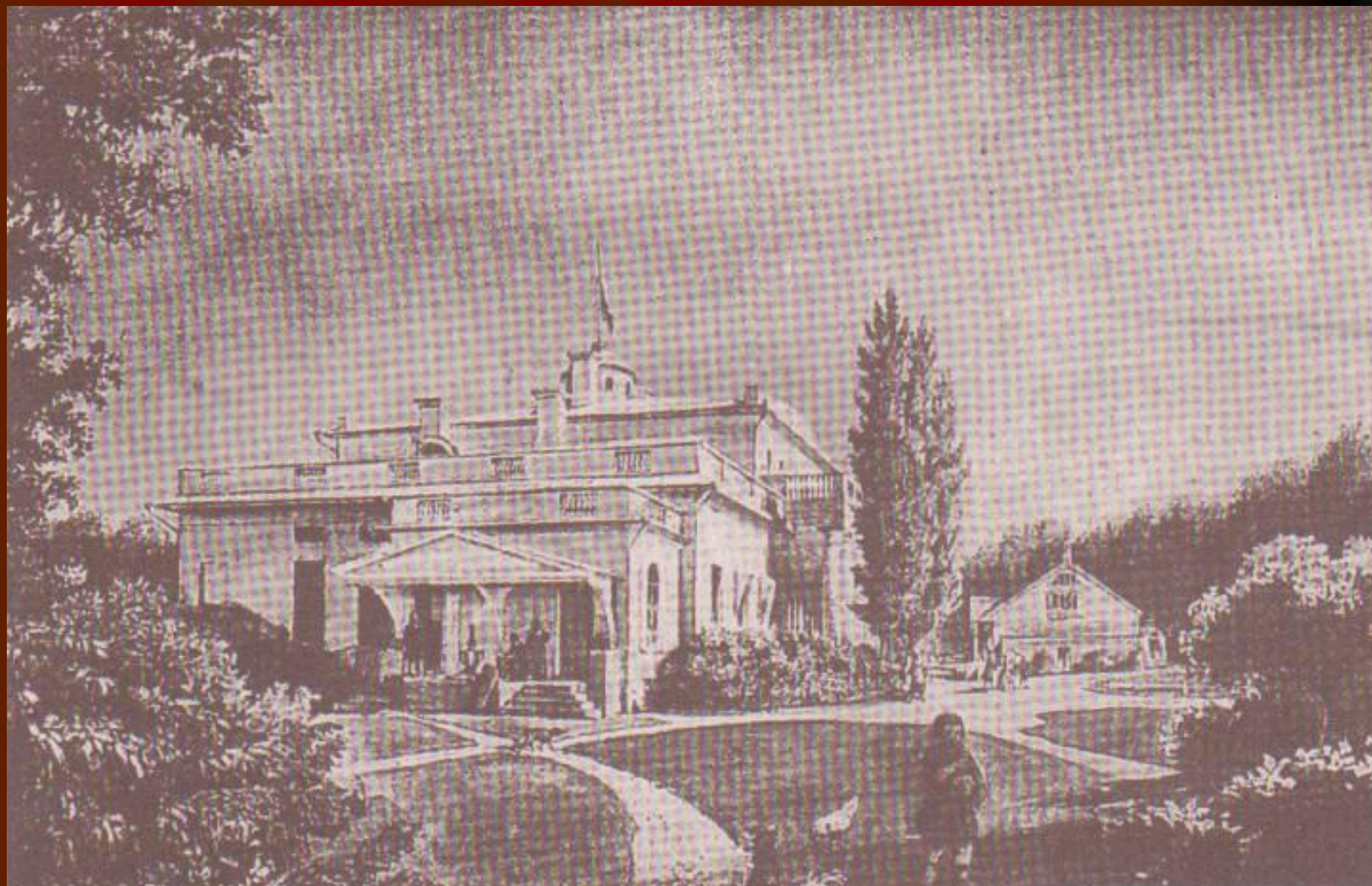
Вид усадьбы Овстуг 1861 год