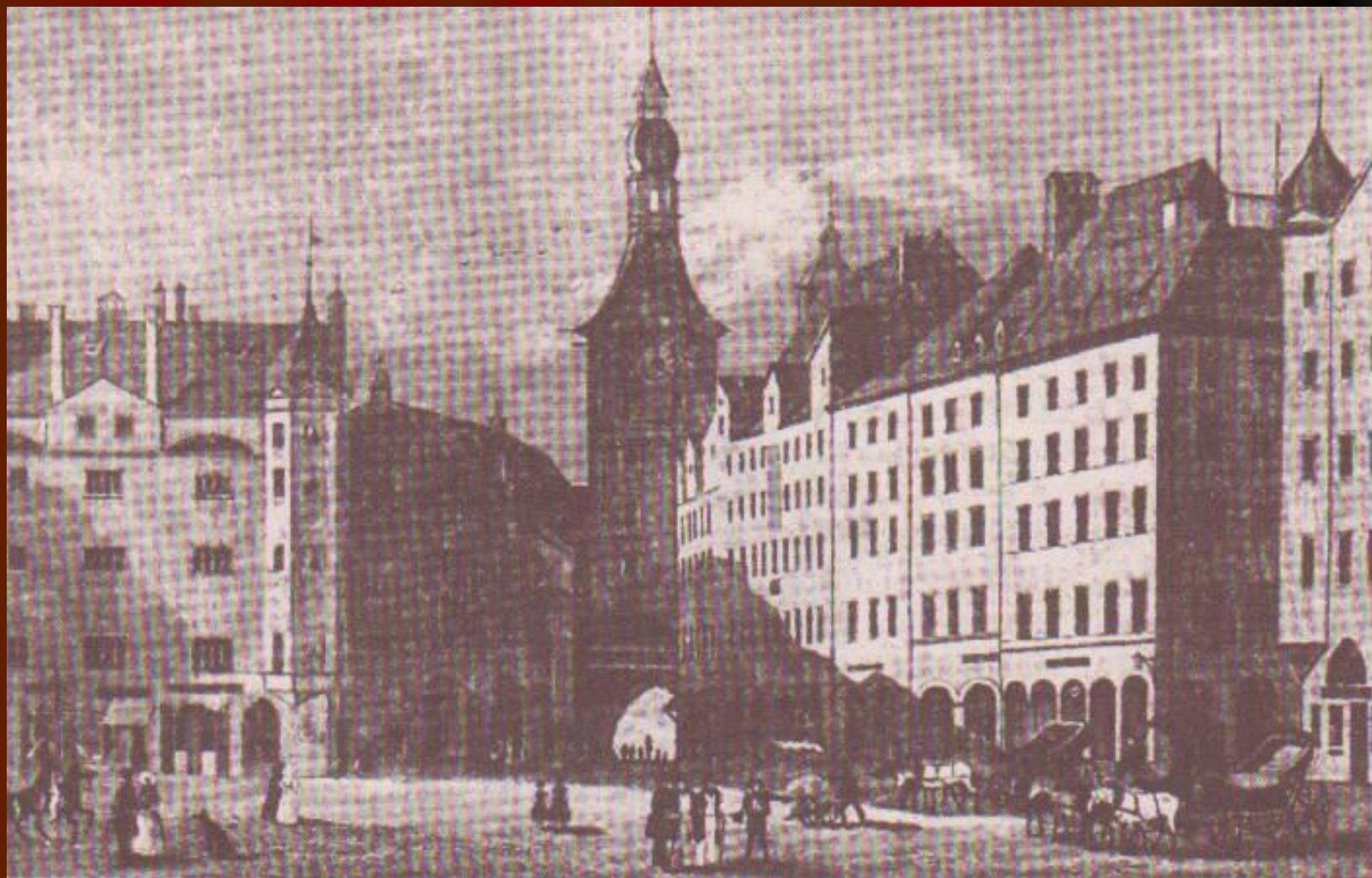
Мюнхен. Городская ратуша