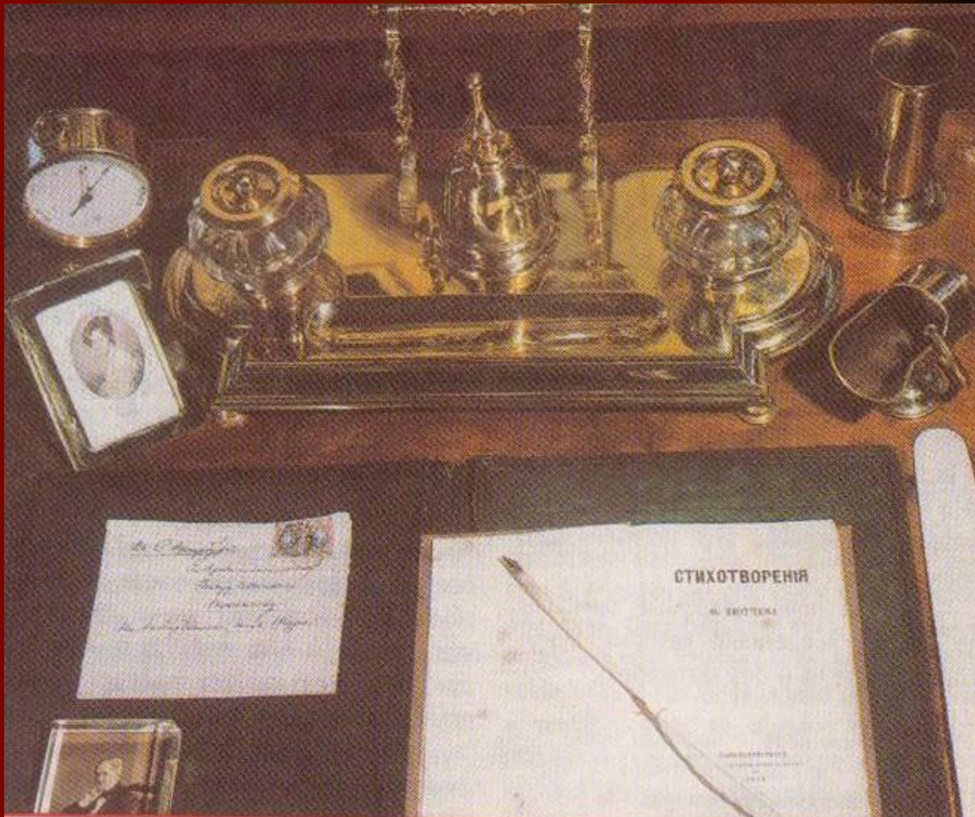
Личные вещи Ф.И.Тютчева. Музей-усадьба Мураново