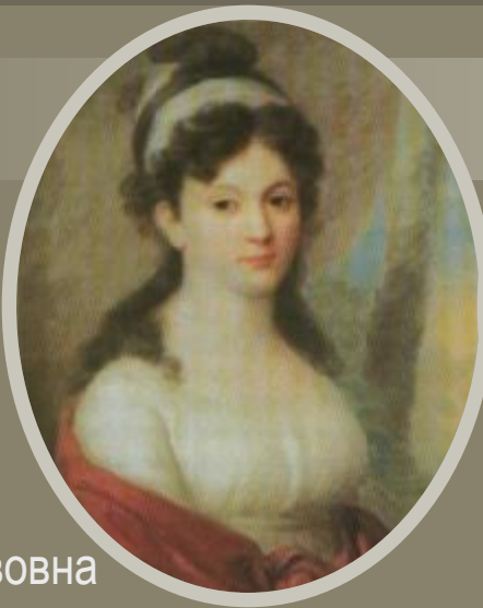
Мать Тютчева Екатерина Львовна