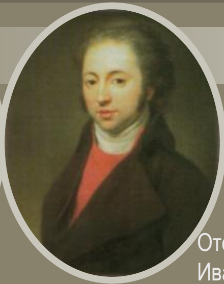
Отец Тютчева Иван Николаевич