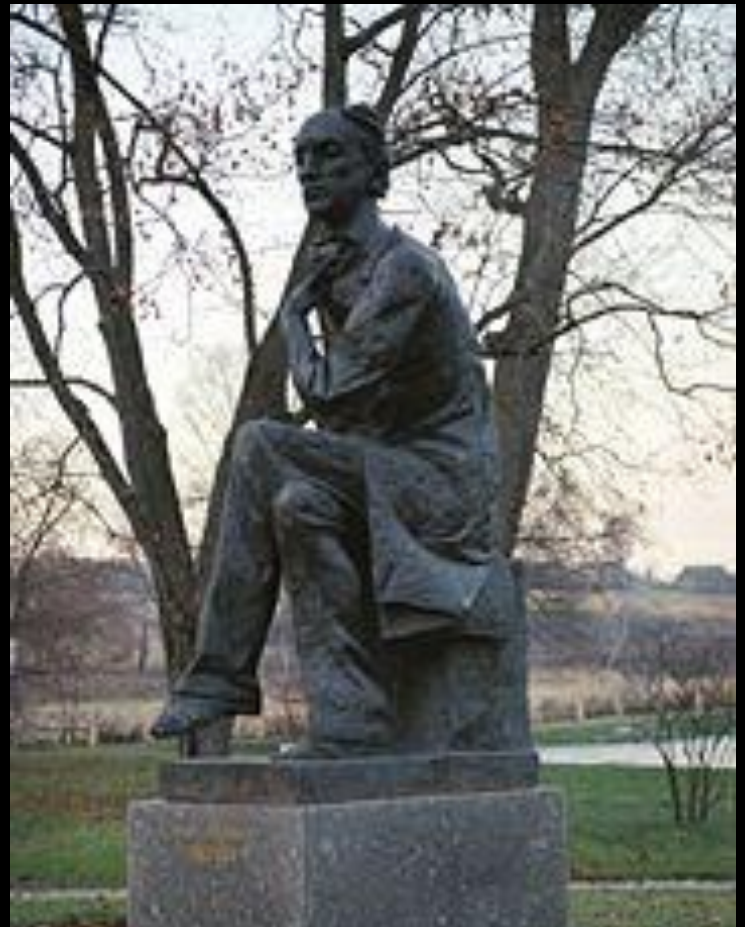
Памятник поэту в Овстуге.

Не рассуждай, не хлопочи!. Безумство ищет, глупость судит; Дневные раны сном лечи, А завтра быть чему, то будет. Живя, умей все пережить: Печаль, и радость, и тревогу. Чего желать? О чем тужить? День пережит - и слава богу!