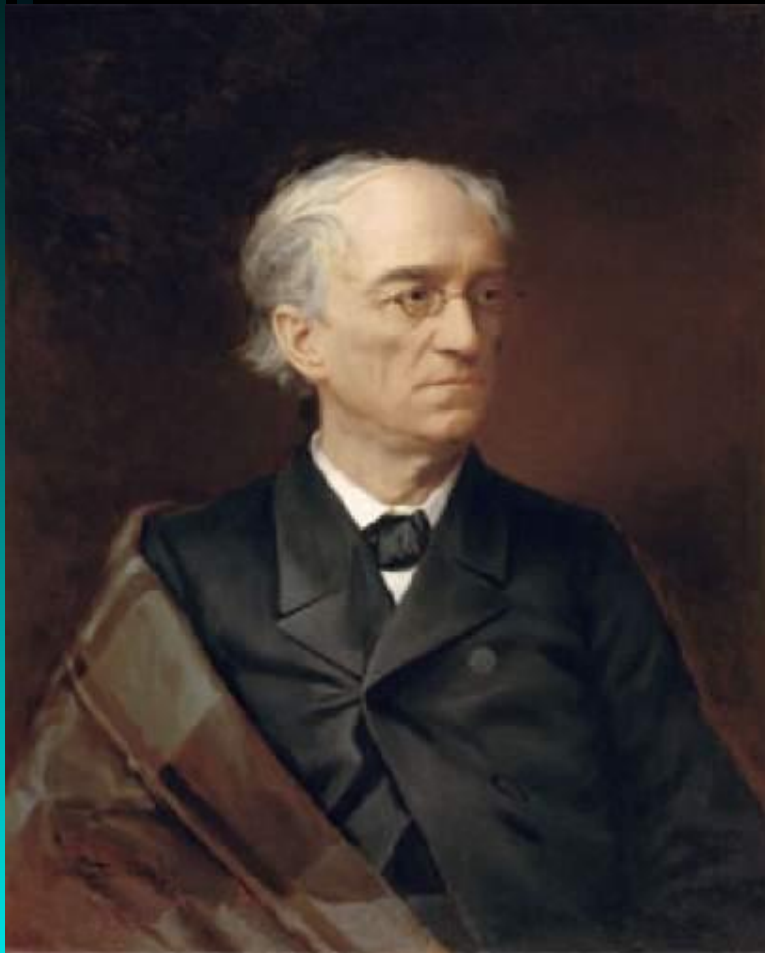
И. Ф. Александровский. Портрет Ф. И. Тютчева

В последние годы жизни Тютчев написал около пятидесяти стихотворений. Самые известные среди них: «Накануне годовщины 4 августа 1864 года» (1865), «Умом Россию не понять...» (1866), «Нам не дано предугадать...» (1869), «Я поздно встретился с тобою...» (1872) и др.