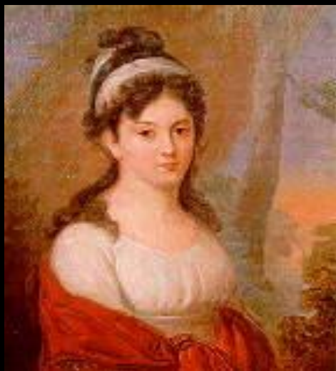
Е. А. Тютчева, мать поэта 1776-1866