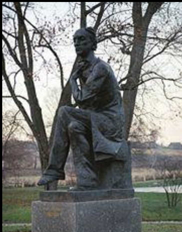
Памятник поэту в Овстуге.

Не рассуждай, не хлопочи!. Безумство ищет, глупость судит; Дневные раны сном лечи, А завтра быть чему, то будет. Живя, умей все пережить: Печаль, и радость, и тревогу. Чего желать? О чем тужить? День пережит - и слава богу!