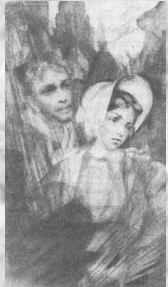
"Белые ночи". Настенька и мечтатель.

1846 - первая повесть, "Бедные люди". В других произведениях 40-х гг. - "Двойник" (1846), "Белые ночи" (1848), "Неточка Незванова" (1849) - возникает тема психологической двойственности человека, характерная и для позднего периода творчества.