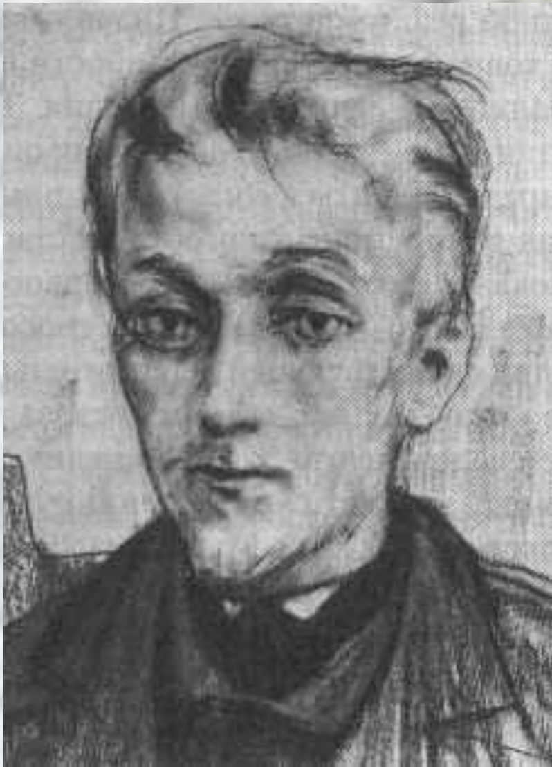
«Идиот». Князь Мышкин

1860-70 - созданы крупнейшие романы - "Преступление и наказание" (1866), "Идиот" (1868), в котором Достоевский стремился создать характер идеально прекрасного человека в лице князя Мышкина. В образе Настасьи Филипповны изображена трагедия женщины, вынужденной продавать свою красоту и не желающей мириться с унижением её человеческого, женского достоинства.