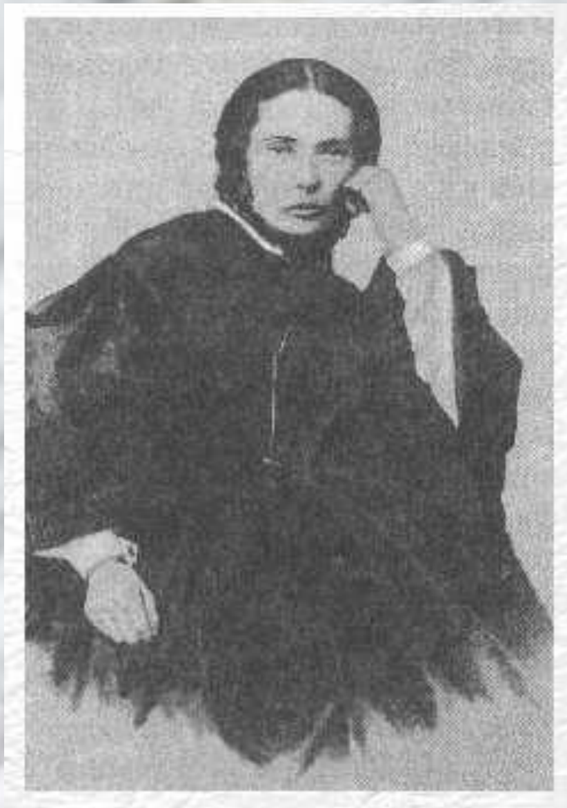
М.Д. Исаева, первая жена Ф.М. Достоевского.