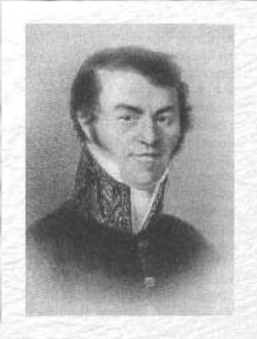
Отец писателя. М. Достоевский.