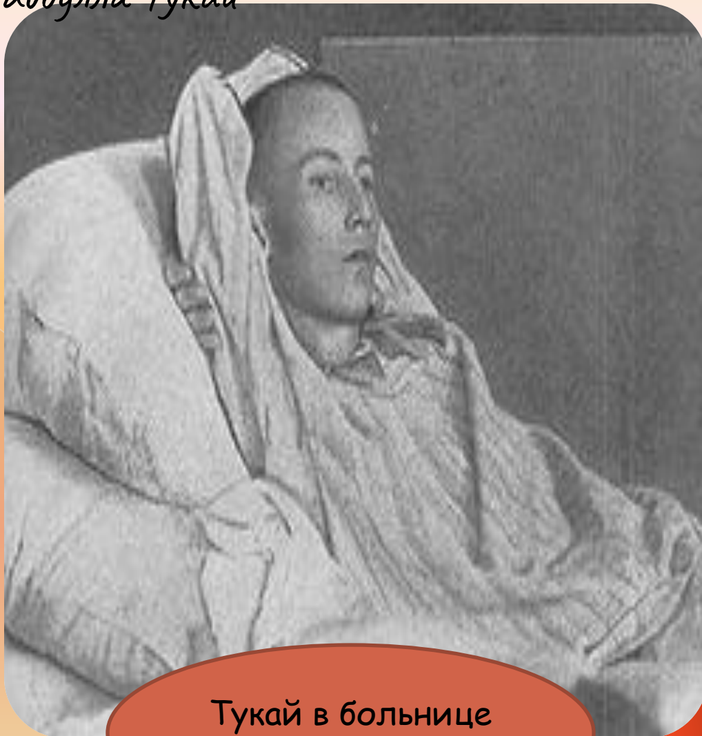
Тукай в больнице 1913