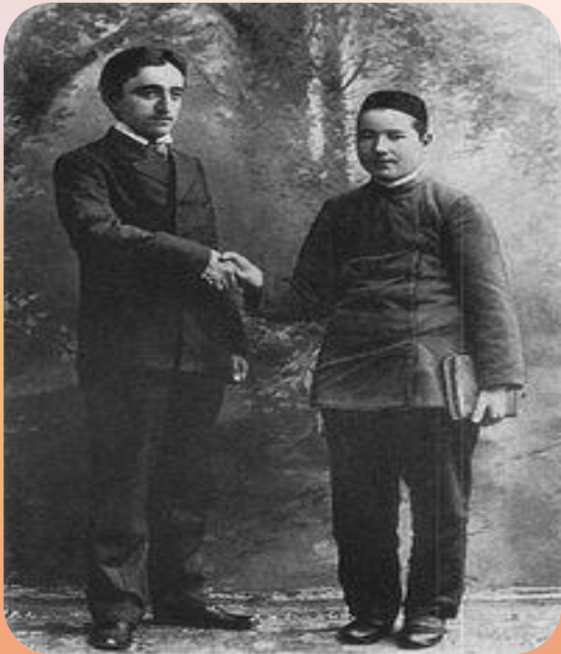
Молодой Тукай (справа) 1905