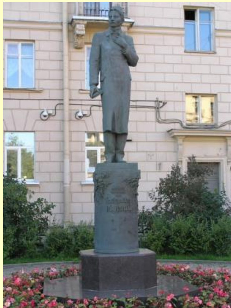
Памятники Габдулле Тукаю в Казани, на площади Тукая и в Санкт-Петербурге, на Зверинской улице