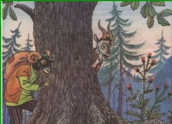
Кәжә белән сарык