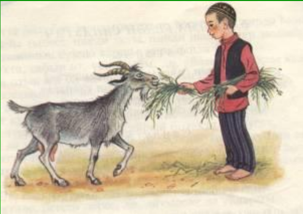
Гали белән кәжә