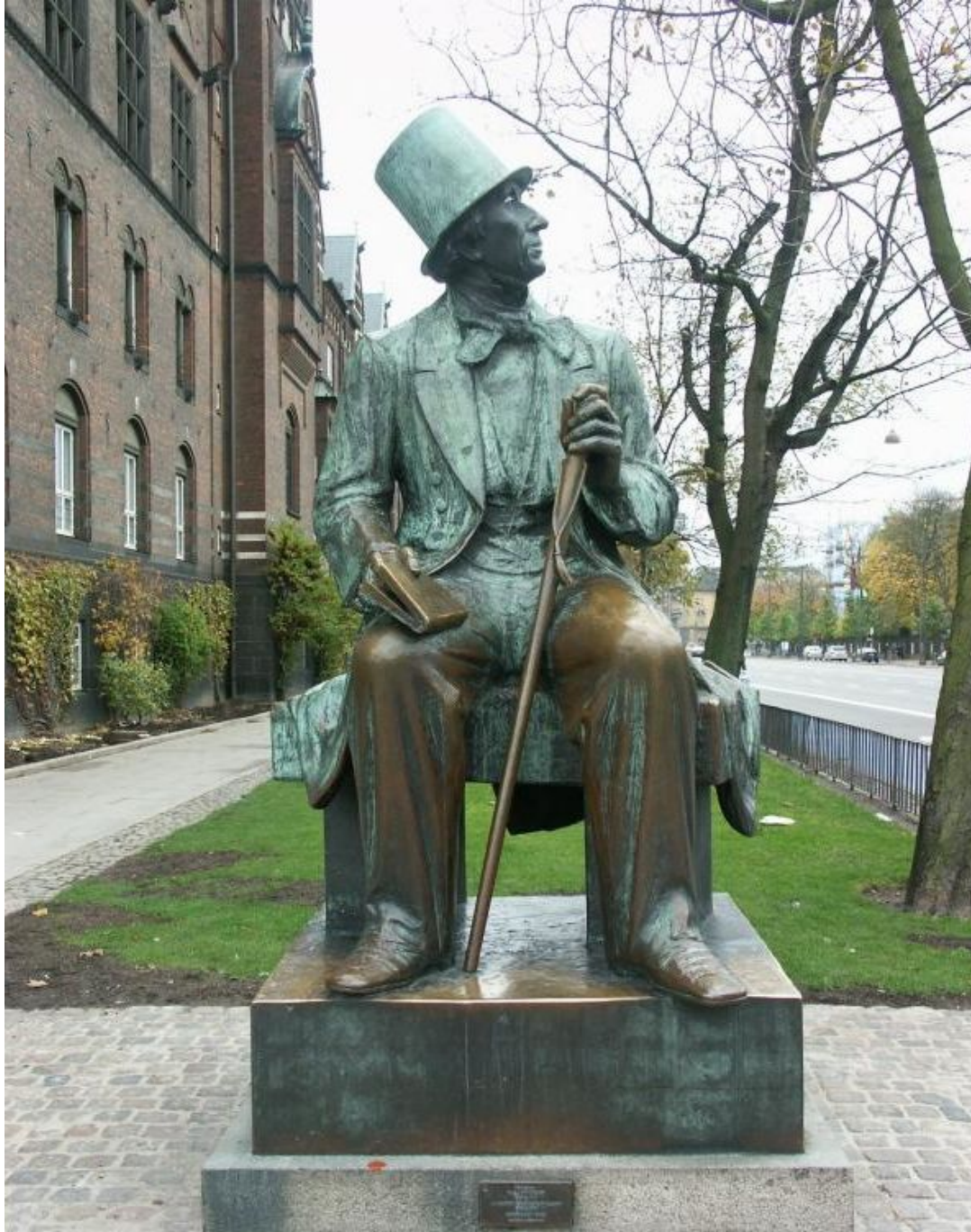
Памятник Г-Х.Андерсену в Копенгагене.