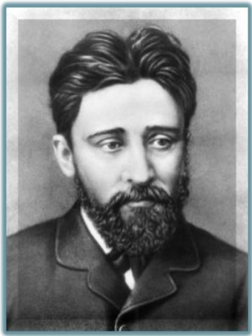
Всеволод Михайлович Гаршин (1855-1888)