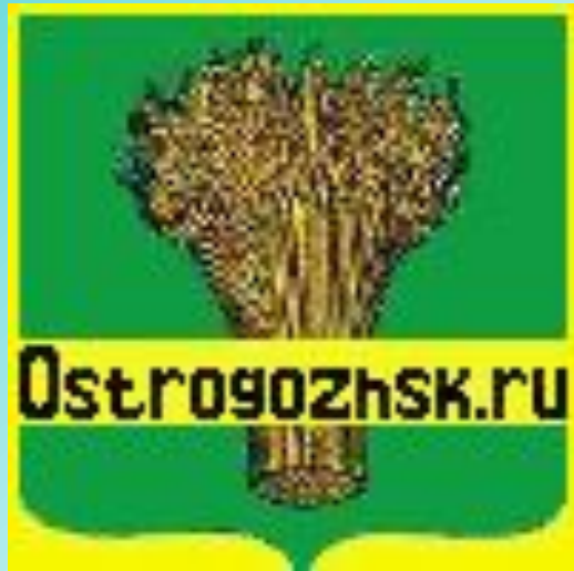
Герб города Острогожска