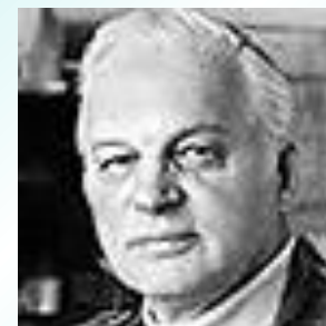
Станислав Иосифович Росточкий - режиссёр фильма «Белый Бим Чёрное ухо»