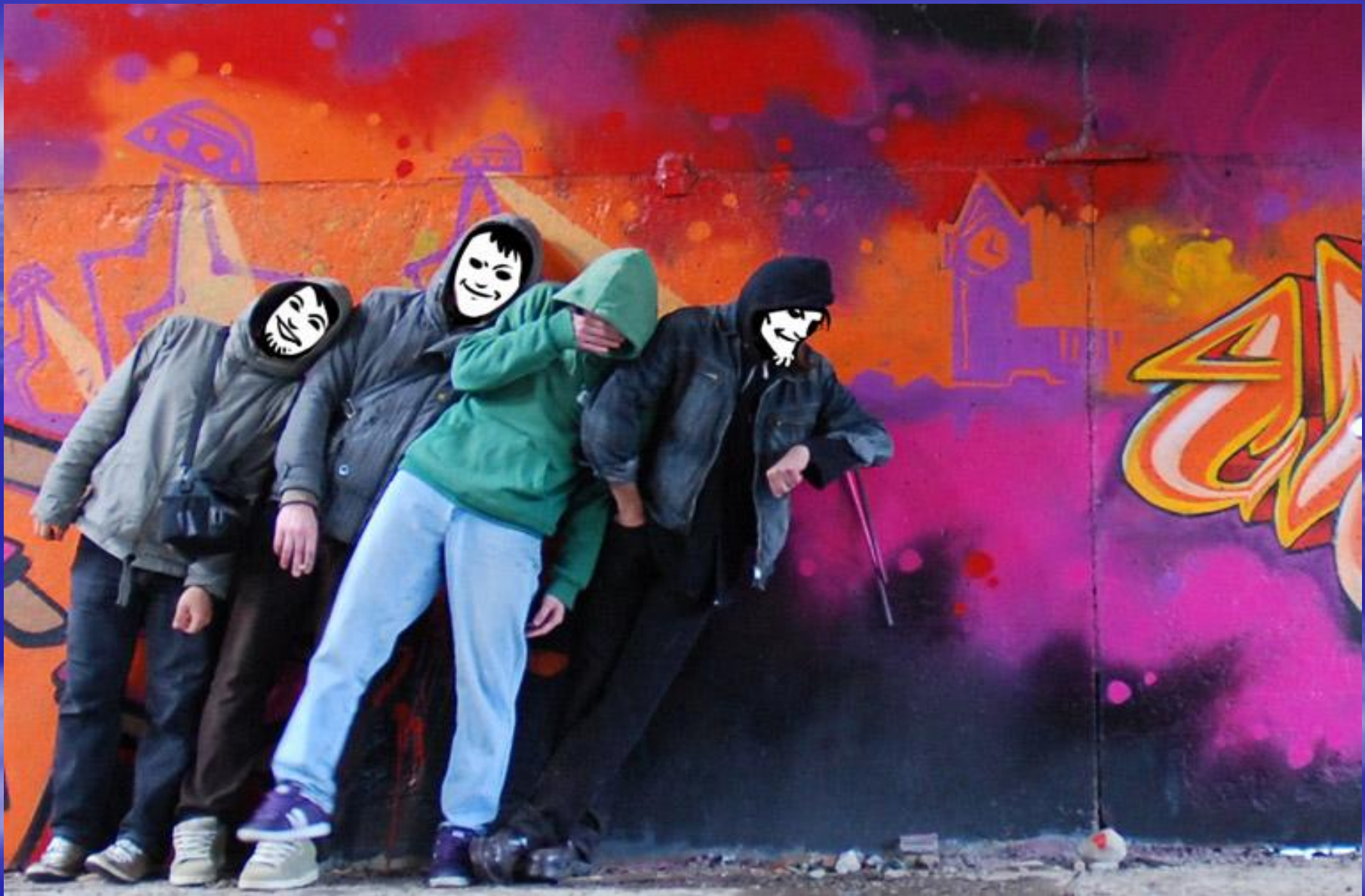
Фрагмент спектакля по мотивам произведений Бредбери.