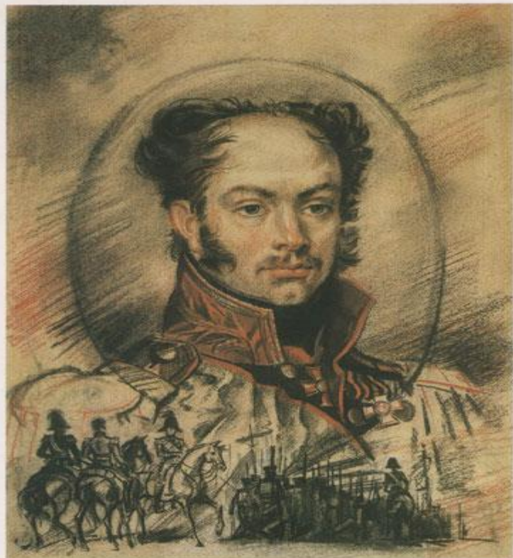
Михаил Федорович Орлов 1788—1842