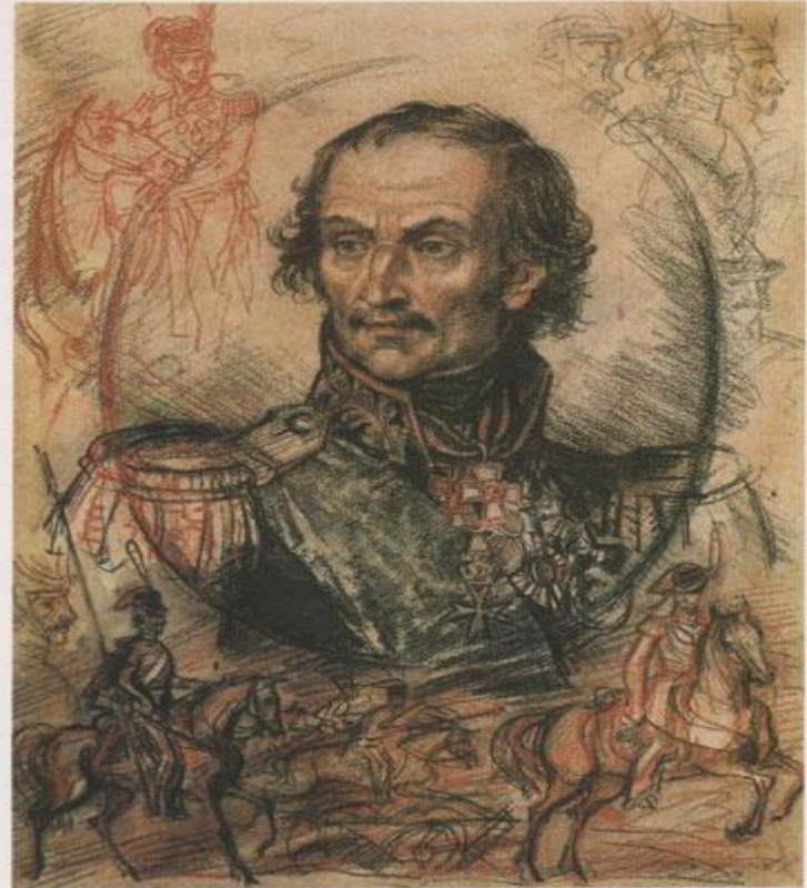
Матвей Иванович Платов 1751—1818