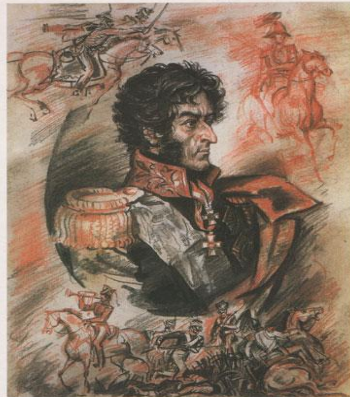
Петр Иванович Багратион 1765—1812

«Багратион — лучший генерал русской армии», — говорил Наполеон. Участник штурма Очакова, Варшавы, Багратион проделал с Суворовым весь Итальянский поход, был его правой рукой. Взятие Брешины, Бергамо, Лекко, Тортоны, Турина и Милана, битва при Треббии, при Нови — везде Багратион находился в самых трудных и решающих местах. Знаменитый Швейцарский поход Суворова принес славу и Багратиону, проявившему героизм, хладнокровие, волю к победе.