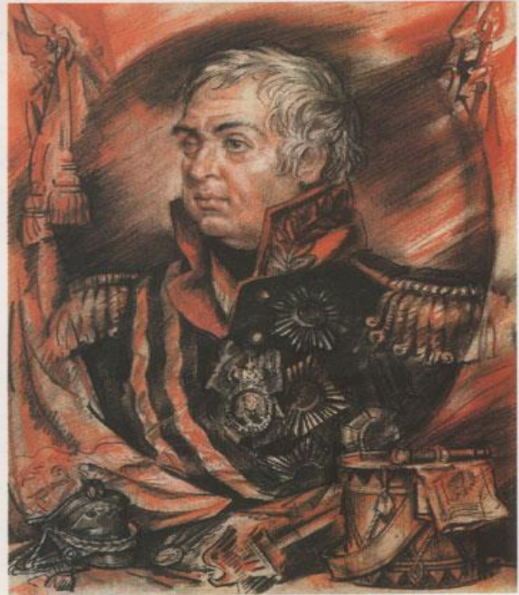
Михаил Илларионович Кутузов 1745—1813

Имя великого русского полководца Михаила Илларионовича Голенищева-Кутузова неотделимо от Отечественной войны 1812 года. Именно в этот завершающий период своей жизни он полностью проявил себя как стратег, государственный деятель, возглавивший народную войну против иноземных захватчиков.