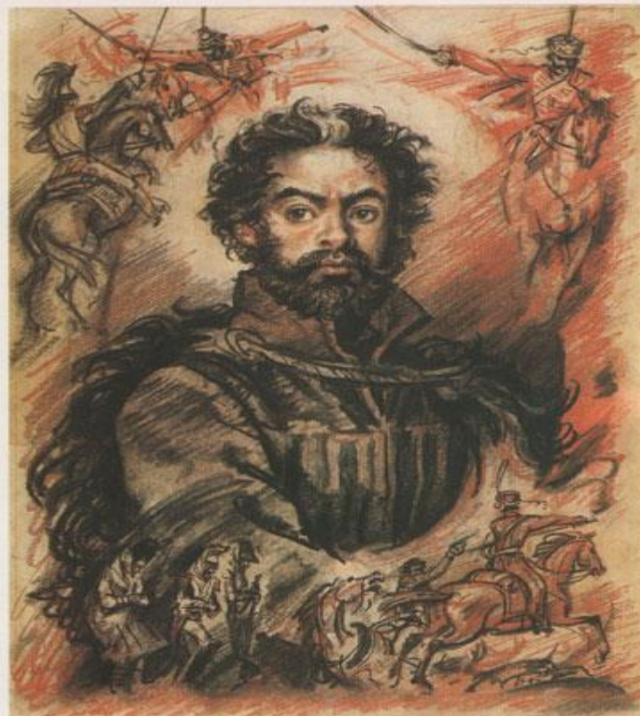
Денис Васильевич Давыдов 1784—1839

«Я был рожден для рокового 1812 года», — писал в автобиографии прославленный поэт-партизан. Денис Васильевич Давыдов, сын командира Полтавского конного полка, в семнадцать лет начал военную службу эстандарт-юнкером в кавалергардском полку, а затем в армейском Белорусском гусарском полку.