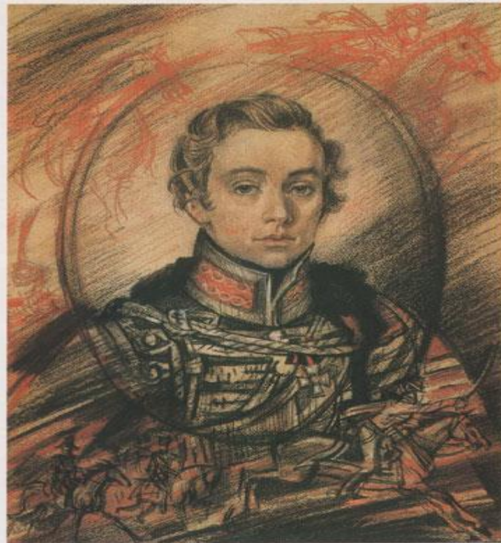
Надежда Андреевна Дурова 1783—1886

Нашествие Наполеона вызвало небывалый патриотический подъем в русском обществе. Во всенародную борьбу с захватчиками входили представители всех слоев населения. Сохранилась память и о героинях той поры.