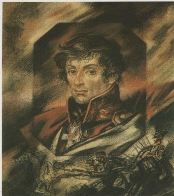
Александр Иванович Остерман-Толстой 1770—1857

Остерман-Толстой начал военную службу при Суворове. Участвовал в штурме Измаила. В кампании 1806—1807 годов отличился в бою у местечка Черного, удерживая позиции в течение 15 часов против Наполеона. Героически сражался под Пултуском и Прейсиш-Эйлау.