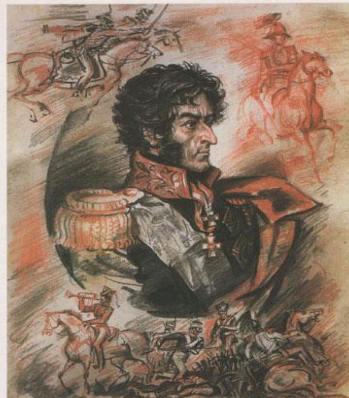
Петр Иванович Багратион 1765—1812

«Багратион — лучший генерал русской армии», — говорил Наполеон. Участник штурма Очакова, Варшавы, Багратион проделал с Суворовым весь Итальянский поход, был его правой рукой. Взятие Брешины, Бергамо, Лекко, Тортоны, Турина и Милана, битва при Треббии, при Нови — везде Багратион находился в самых трудных и решающих местах. Знаменитый Швейцарский поход Суворова принес славу и Багратиону, проявившему героизм, хладнокровие, волю к победе.