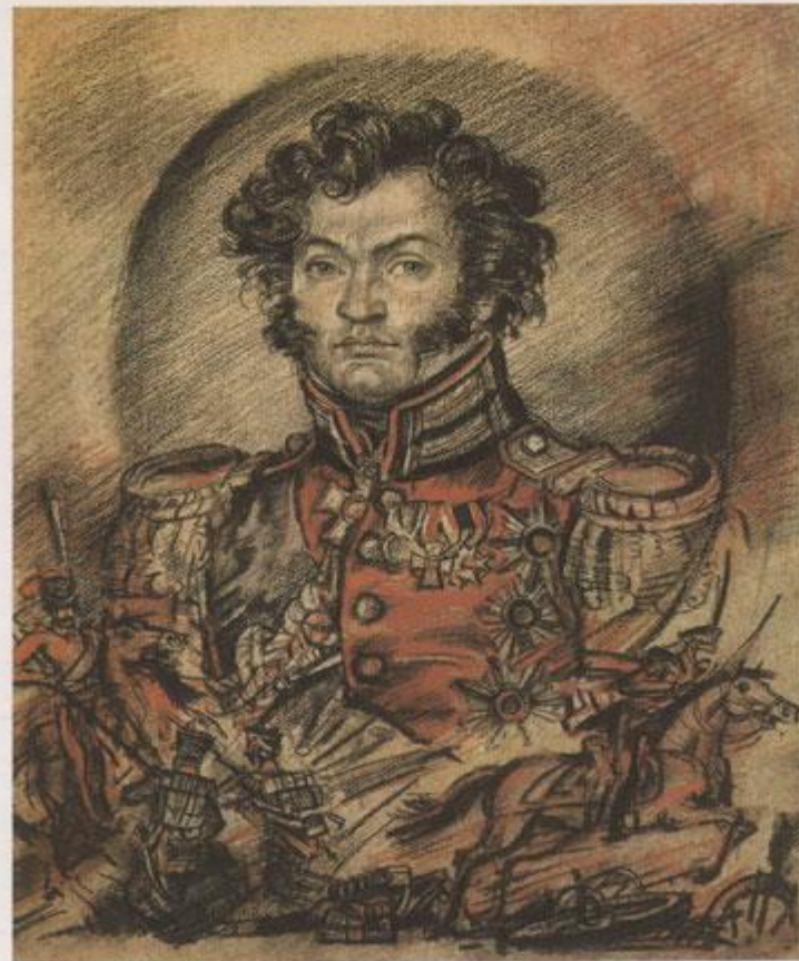
Федор Павлович Уваров 1769—1824

В 27 лет был произведен в генералы. Участвовал в кампаниях 1805—1807 годов и в сражениях на Дунае в 1810 году.