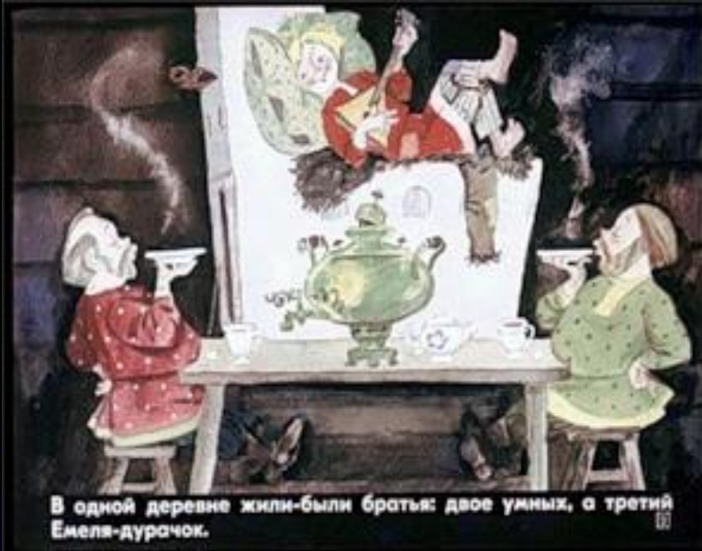
В одной деревне жили-были братья: двое умных, а третий Емеля-дурачок.