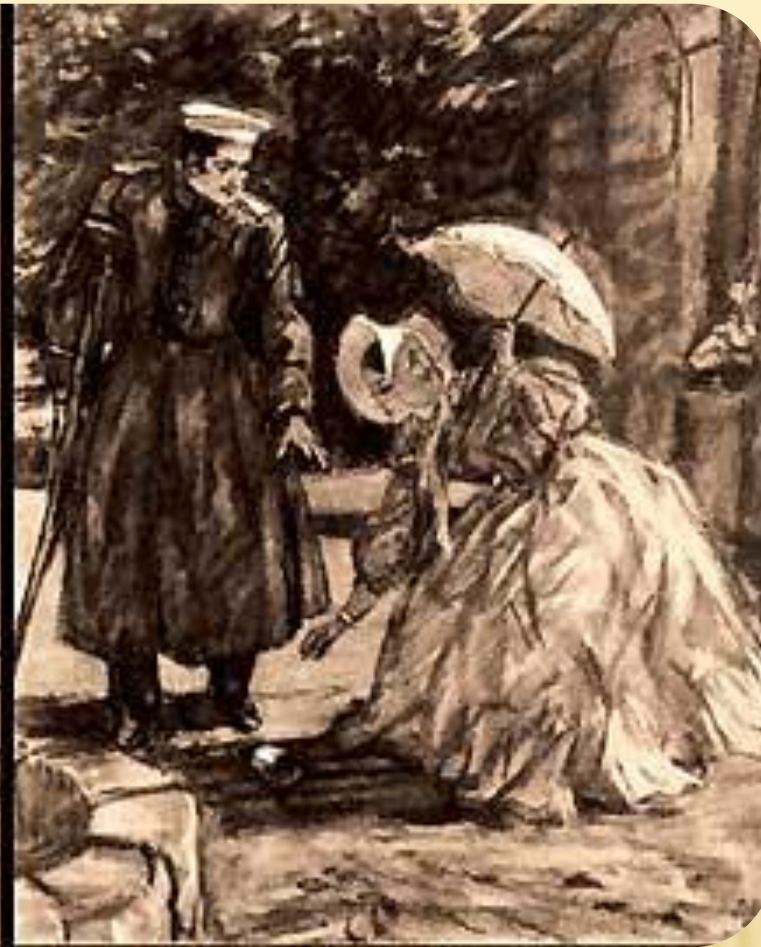
М. Врубель. Княжна Мери и Грушницкий. 1890.