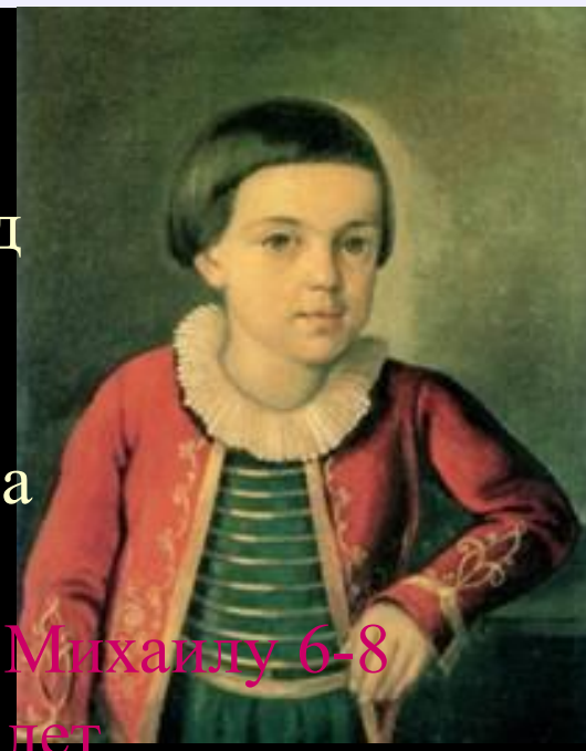
Михаилу 6-8 лет

И вижу я себя ребёнком, и кругом Родные все места: высокий барский дом И сад с разрушенной теплицей; Зелёной сетью трав подёрнут спящий пруд, А за прудом село дымится — и встают Вдали туманы над полями.