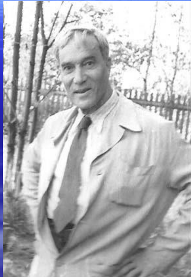
■ Б.Л. Пастернак (1890–1960).