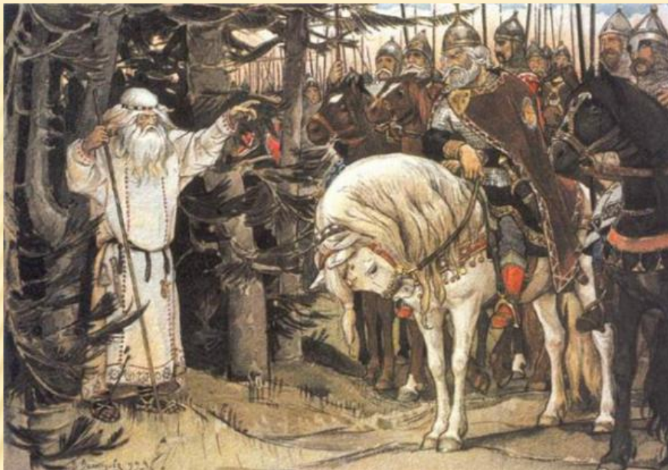
Песнь о вещем Олеге