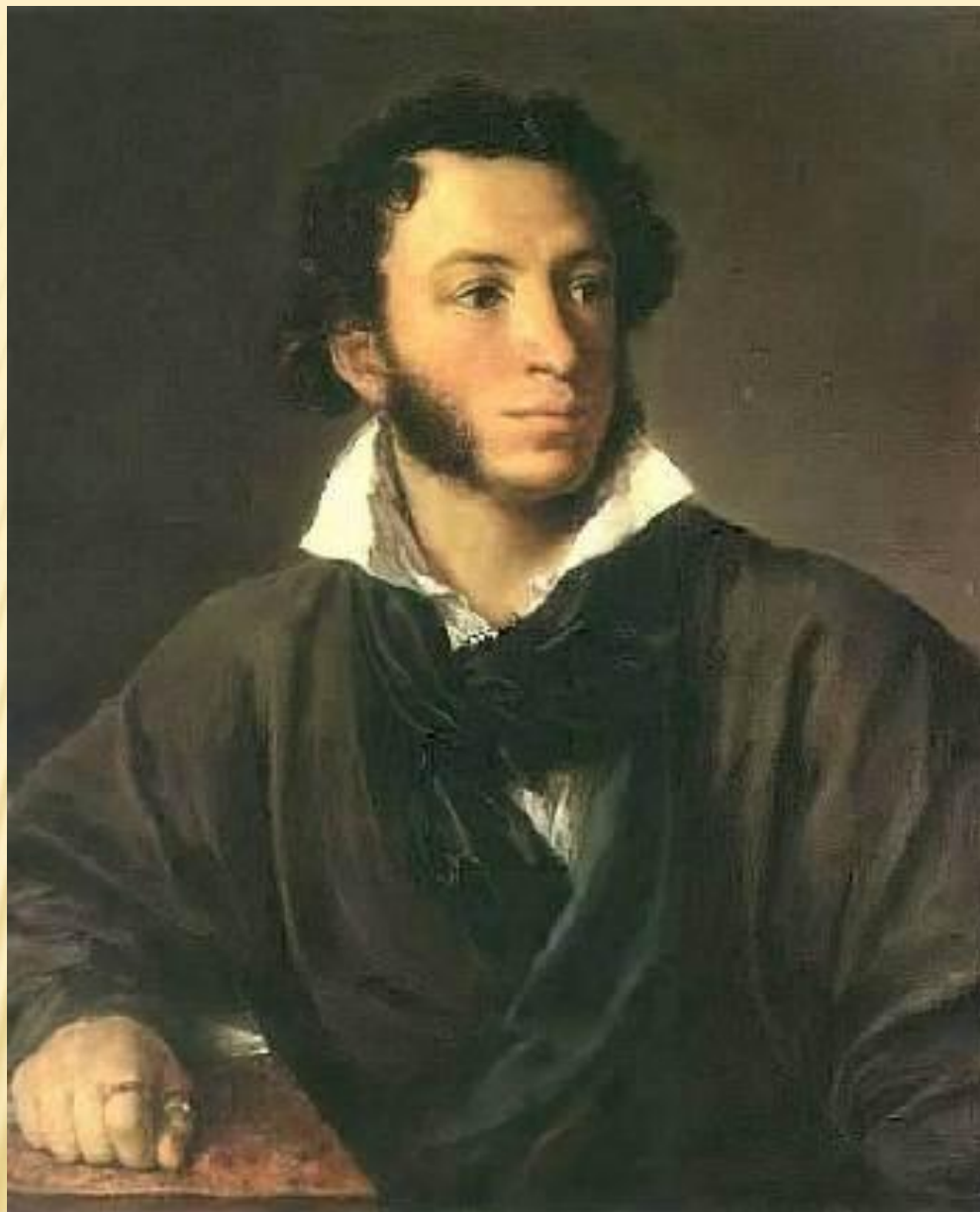
Александр Сергеевич Пушкин Портрет работы О.Кипренского