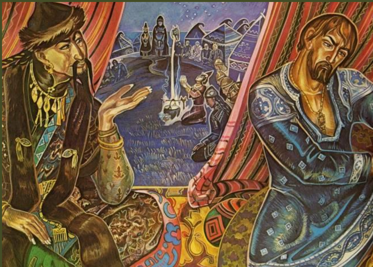
«Князь Игорь в плену»