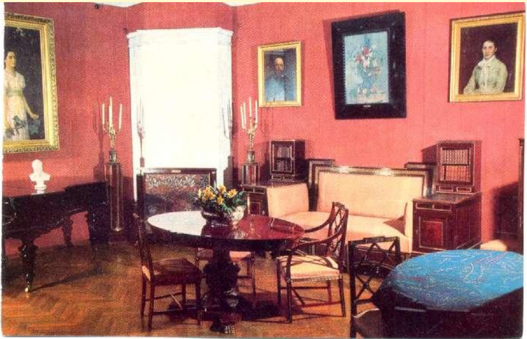
Красная гостиная в музее- усадьбе «Абрамцево», где Н.В. Гоголь прочел первую главу второго тома «Мертвых душ» своим друзьям.