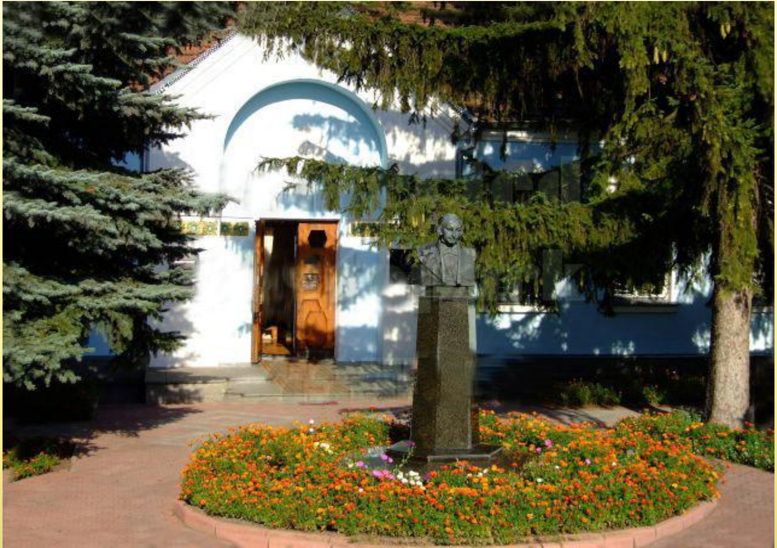
Дом, где родился писатель, теперь литературно-мемориальный музей Н. В. Гоголя.