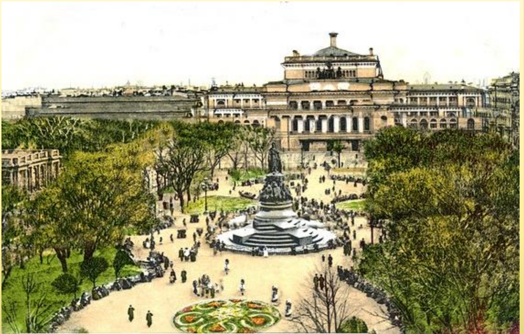
Александринский театр и памятник Екатерине II. Санкт-Петербург. Почтовая открытка.