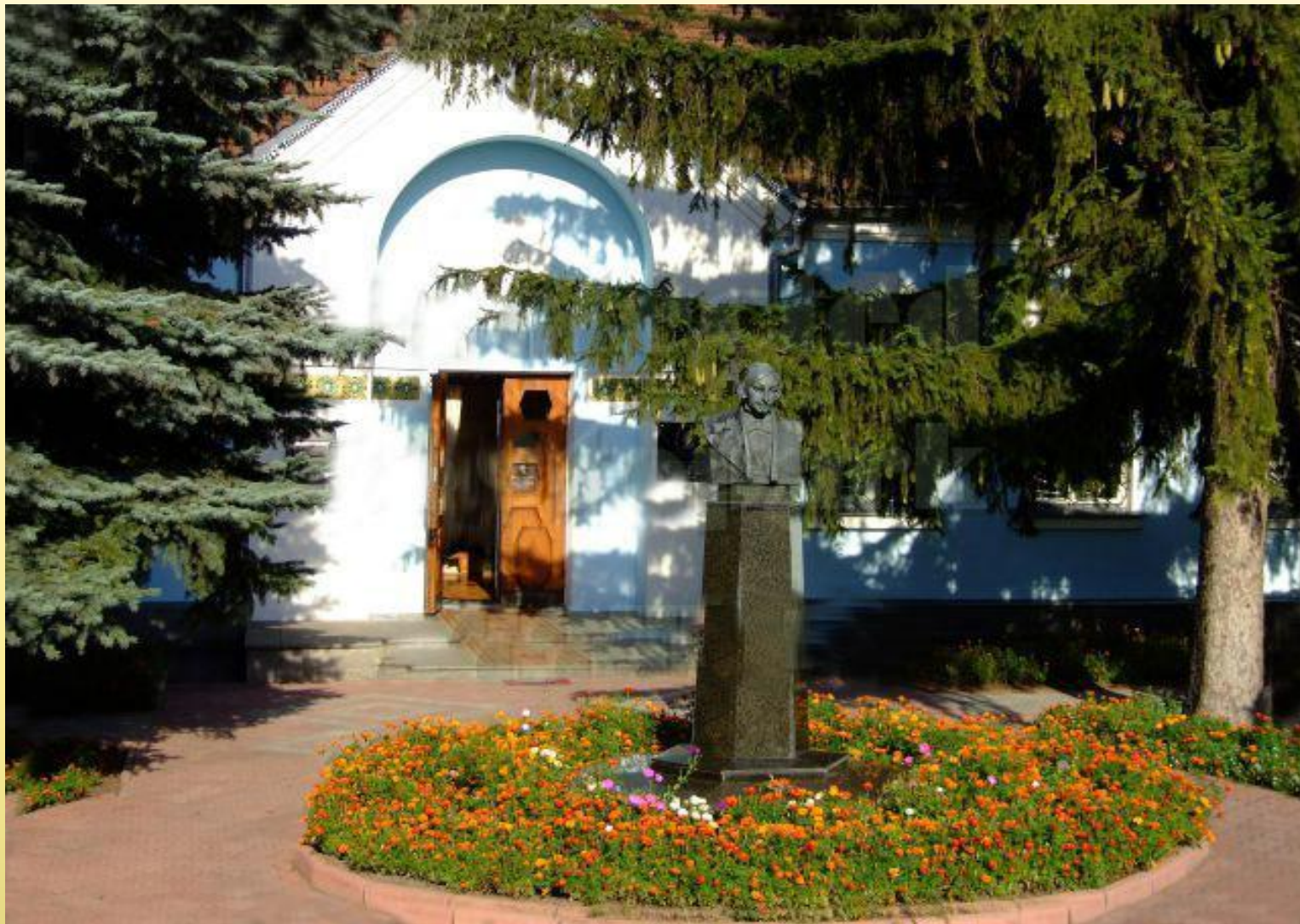
Дом, где родился писатель, теперь литературно-мемориальный музей Н. В. Гоголя.