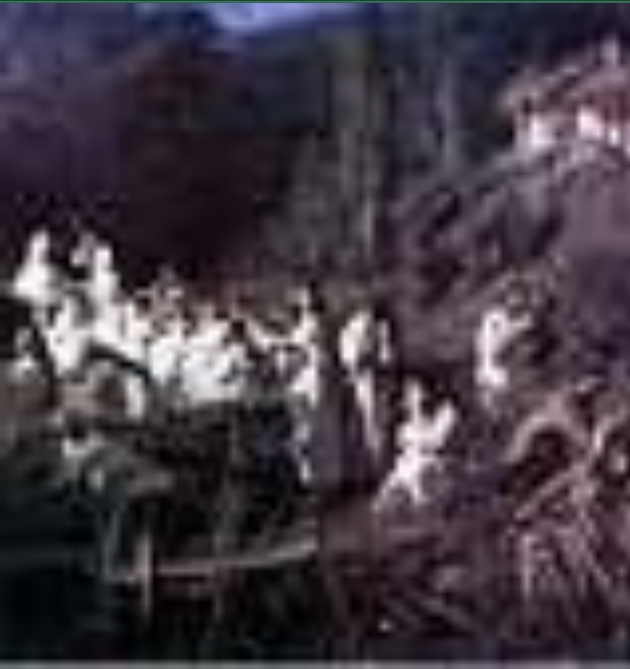
«Майская ночь, или Утопленница»

Литературную известность Гоголю принесли "Вечера на хуторе близ Диканьки" (1831 - 1832), повести "Сорочинская ярмарка", "Майская ночь" и др. В 1833 пришел к решению посвятить себя научной и педагогической работе и в 1834 был назначен адъюнкт-профессором по кафедре всеобщей истории при Санкт-Петербургском университете.