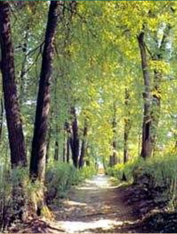
Аллея Гоголя в Абрамцеве

В 1832 году Гоголь познакомился с русским писателем С. Т. Аксаковым. С тех пор Гоголь всей душой был привязан к семье Аксаковых. Дружба их продолжалась двадцать лет, до конца его жизни. 14 августа 1849 года Гоголь впервые приехал в Абрамцево. Оно полюбилось ему.