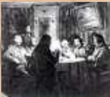
Н.В. Гоголь читает "Ревизора" 5 ноября 1851 года в доме на Суворовском бульваре в Москве