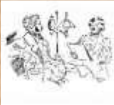
Гоголь и Пушкин

Вскоре после постановки "Ревизора", затравленный реакционной печатью и "светской чернью". Гоголь уехал в Германию, конец лета провёл в Швейцарии, затем поселился в Париже, продолжая работу над "Мертвыми душами", начатую в России. Известие о гибели Пушкина было для него страшным ударом. В марте 1837 поселился в Риме. Во время приезда в Россию в 1839 - 40 читал друзьям главы из первого тома "Мертвых душ", который был завершен в Риме в 1840 - 41.