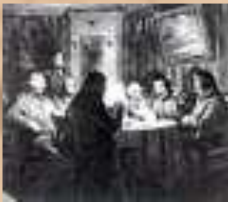
Н.В. Гоголь читает "Ревизора" 5 ноября 1851 года в доме на Суворовском бульваре в Москве