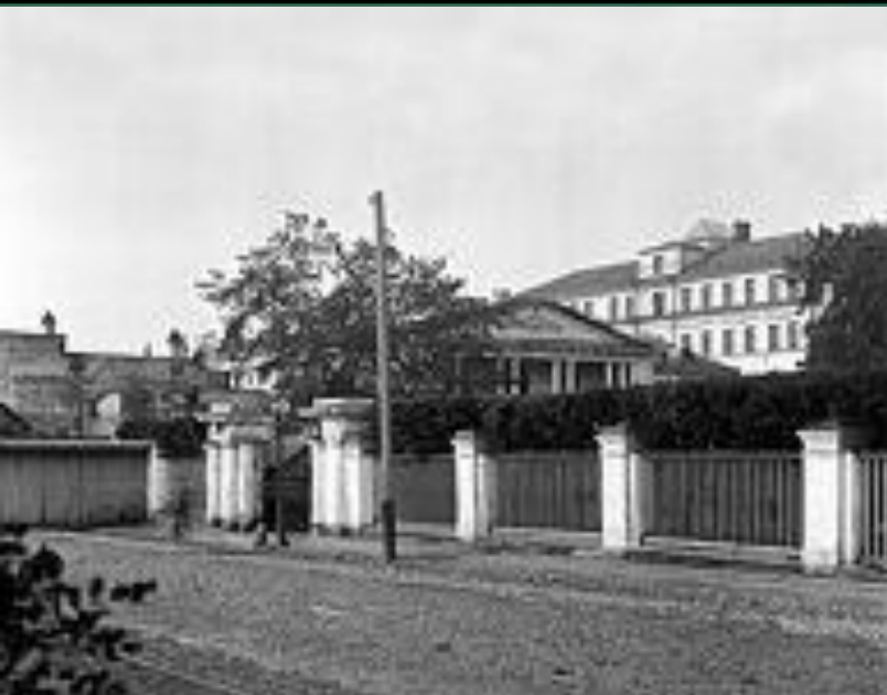
Двор дома на Никитском бульваре

21 февраля утром Гоголь умер в своей последней квартире в доме Талызина в Москве.