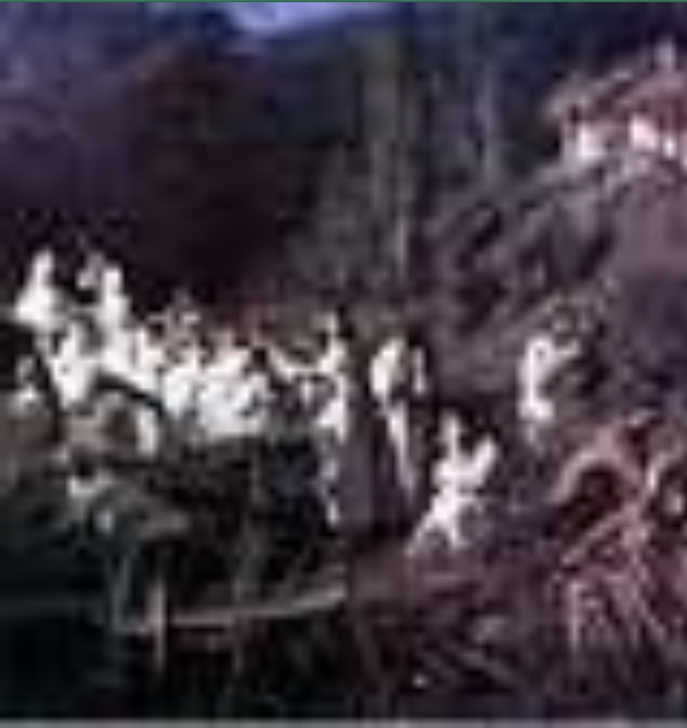
«Майская ночь, или Утопленница»

Литературную известность Гоголю принесли "Вечера на хуторе близ Диканьки" (1831 - 1832), повести "Сорочинская ярмарка", "Майская ночь" и др. В 1833 пришел к решению посвятить себя научной и педагогической работе и в 1834 был назначен адъюнкт-профессором по кафедре всеобщей истории при Санкт-Петербургском университете.