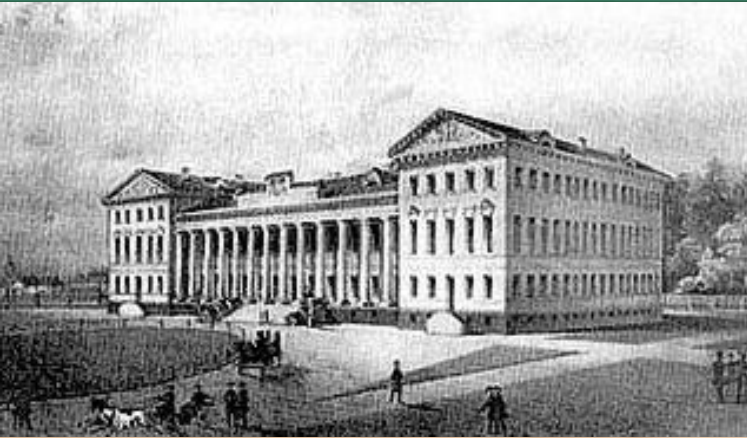
Нежин. Гимназия высших наук

После домашнего образования Гоголь провел два года в Полтавском уездном училище, затем поступил в Нежинскую гимназию высших наук, созданную по типу Царскосельского лицея для детей провинциального дворянства. Здесь учится играть на скрипке, занимается живописью, участвует в спектаклях, исполняя комические роли. Думая о своем будущем, останавливается на юстиции, мечтая "пресекать неправосудие".