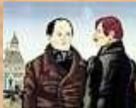
Гоголь и Щепкин