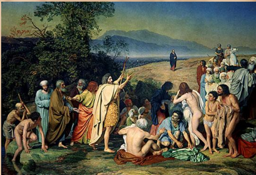
А. А. Иванов «Явление Христа народу» 1837 - 1857 гг.