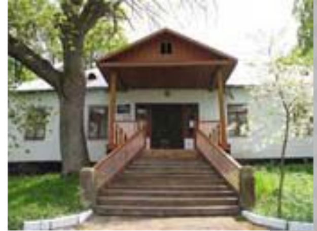
Музей на Украине