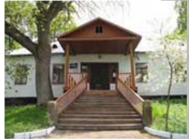
Музей на Украине