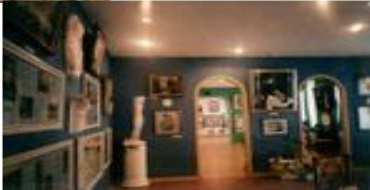
Муниципальный музей. «Анна Ахматова. Серебряный век»