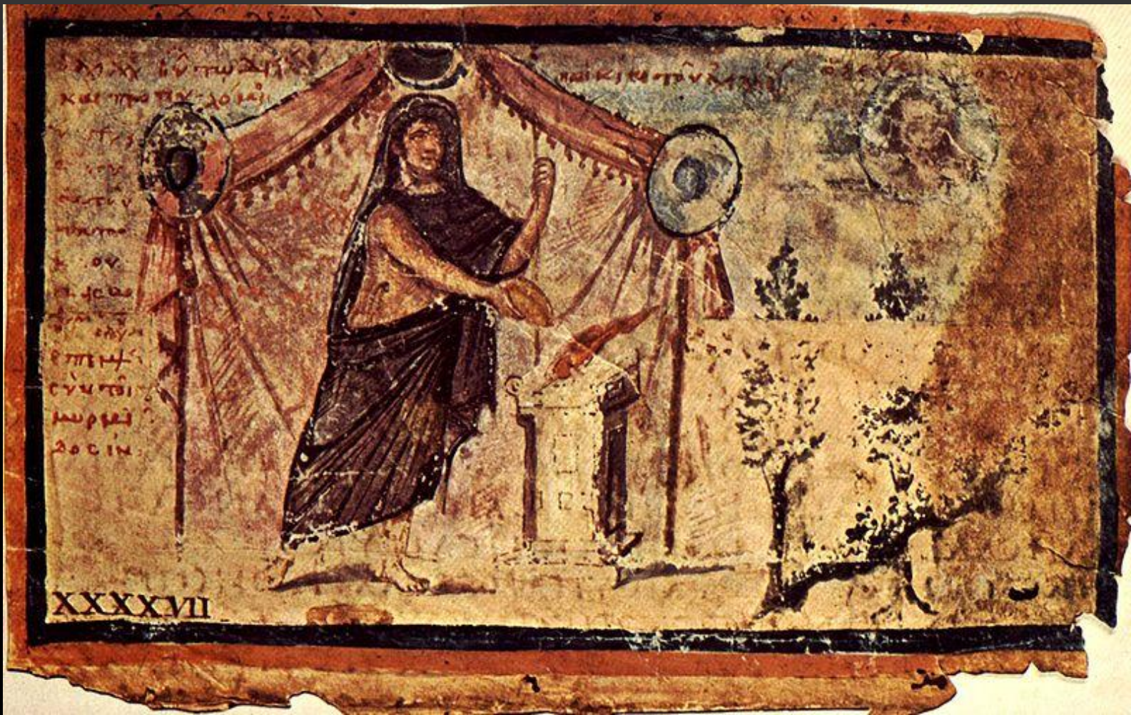
Средневековая иллюстрация к «Илиаде»