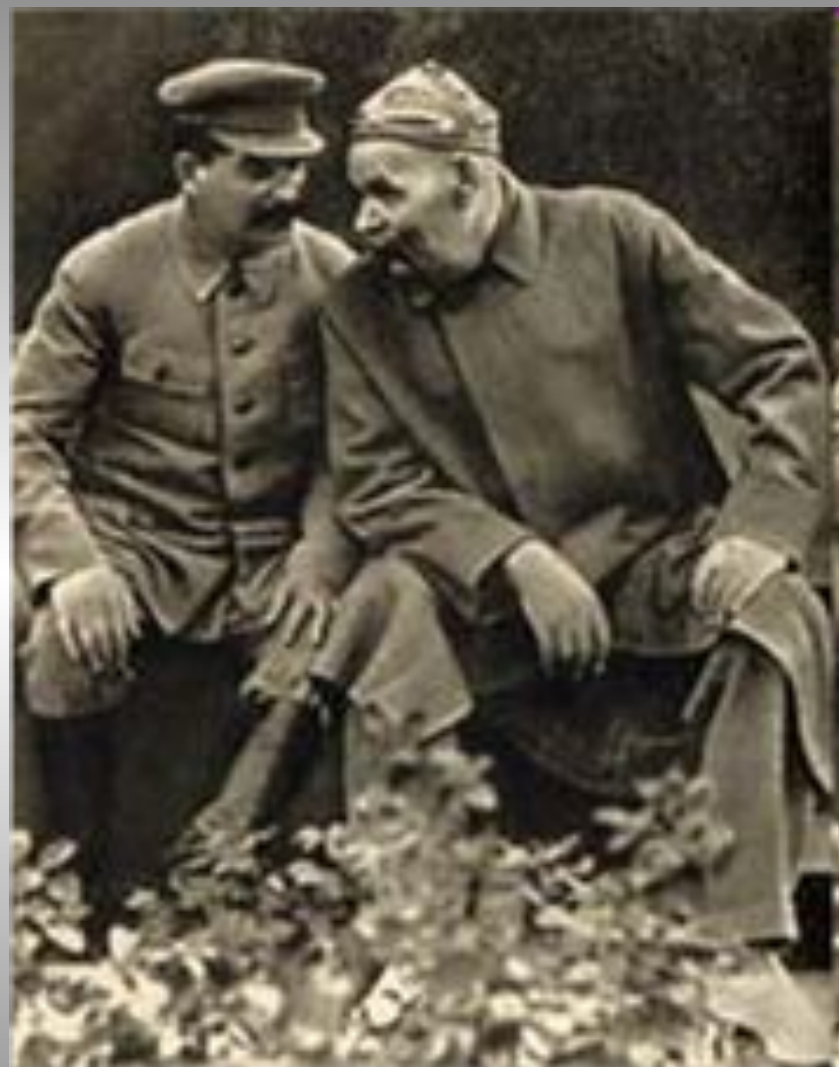
М.Горький и И.Сталин. 1930-е гг.