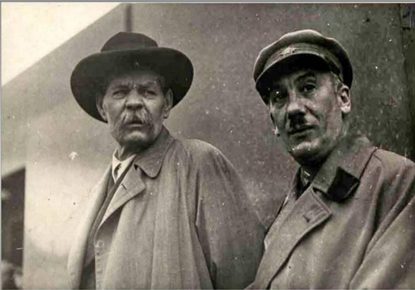
М.Горький и Г.Ягода, народный комиссар внутренних дел. 1930-е гг.