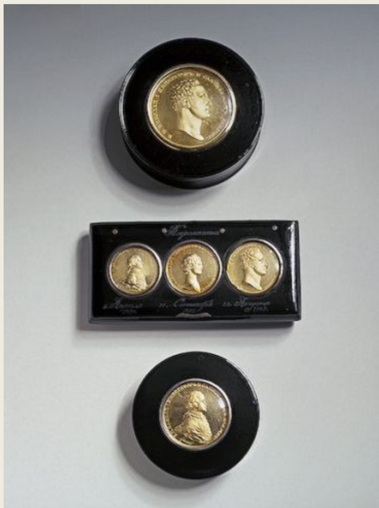
Табакерки с портретом Павла I