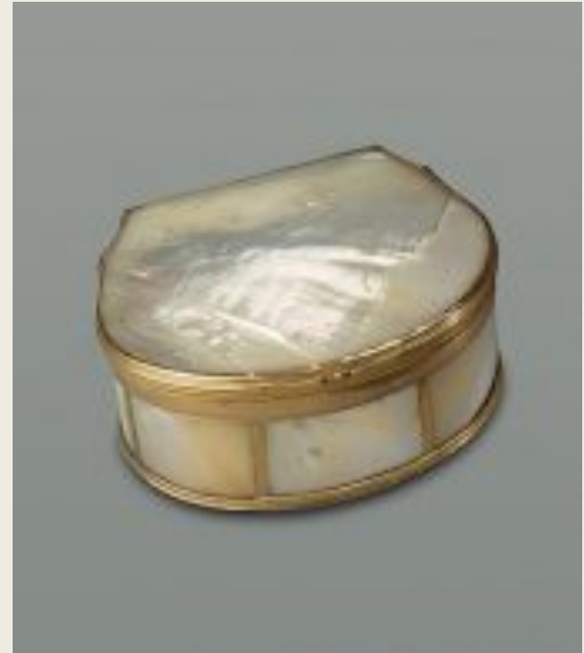
Табакерка Золото, перламутр.