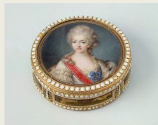
Табакерка с портретом княгини Екатерины Орловой-Зиновьевой

Золото, эмаль; чеканка, роспись. Выс. 2.3 см, диам. 7.5 см