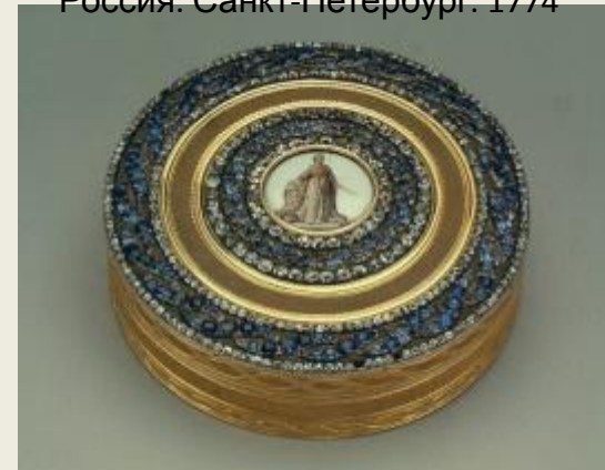
Табакерка с памятником Екатерине II

Золото, серебро, эмаль, бриллианты, сапфиры; литье, чеканка, роспись, пунцирование, гильошировка. Выс. 1.9; диам. 6.9 см