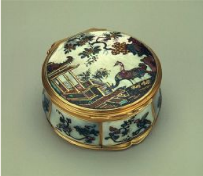
Табакерка Золото, перламутр; литье, чеканка, инкрустация. Выс. 2.8; диам. 5.6 см