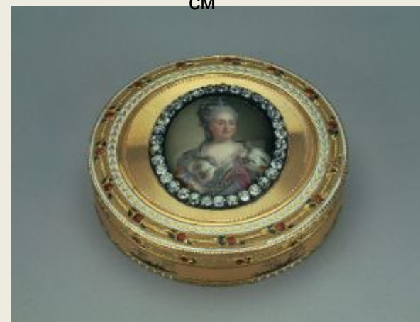
Табакерка со съёмной крышкой, с портретом Екатерины II

Золото, эмаль; чеканка, роспись. Выс. 2.3 см, диам. 7.5 см