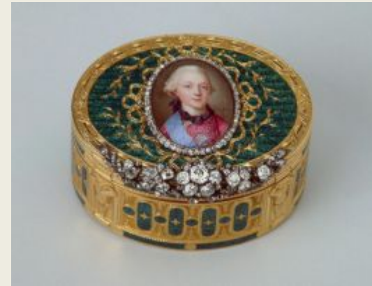
Табакерка с портретом великого князя Павла Петровича

Материалы: гелиотроп, золото, алмазы, рубины, изумруды, стакан, фольга